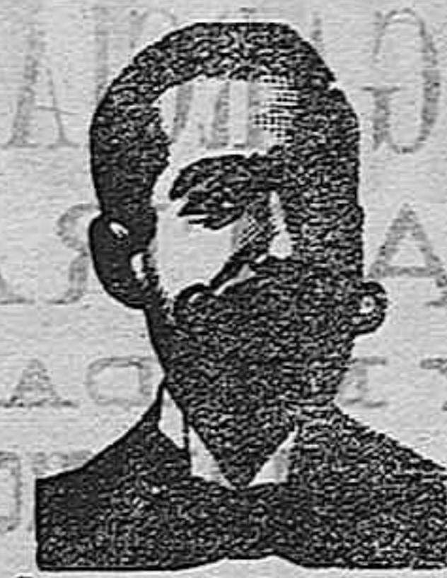
Inventor de los renombrados medicamentos COSTANZI

La debilidad nerviosa ó neurastenia, la anemia, la clorosis, convalecencias, dispepsias (pereza de digerir), raquitismo, (crecimiento defectuoso), y demás afecciones que reconocen por causa UN ESTADO DE DEBILIDAD GENERAL se curan pronto tomando el acreditado me-