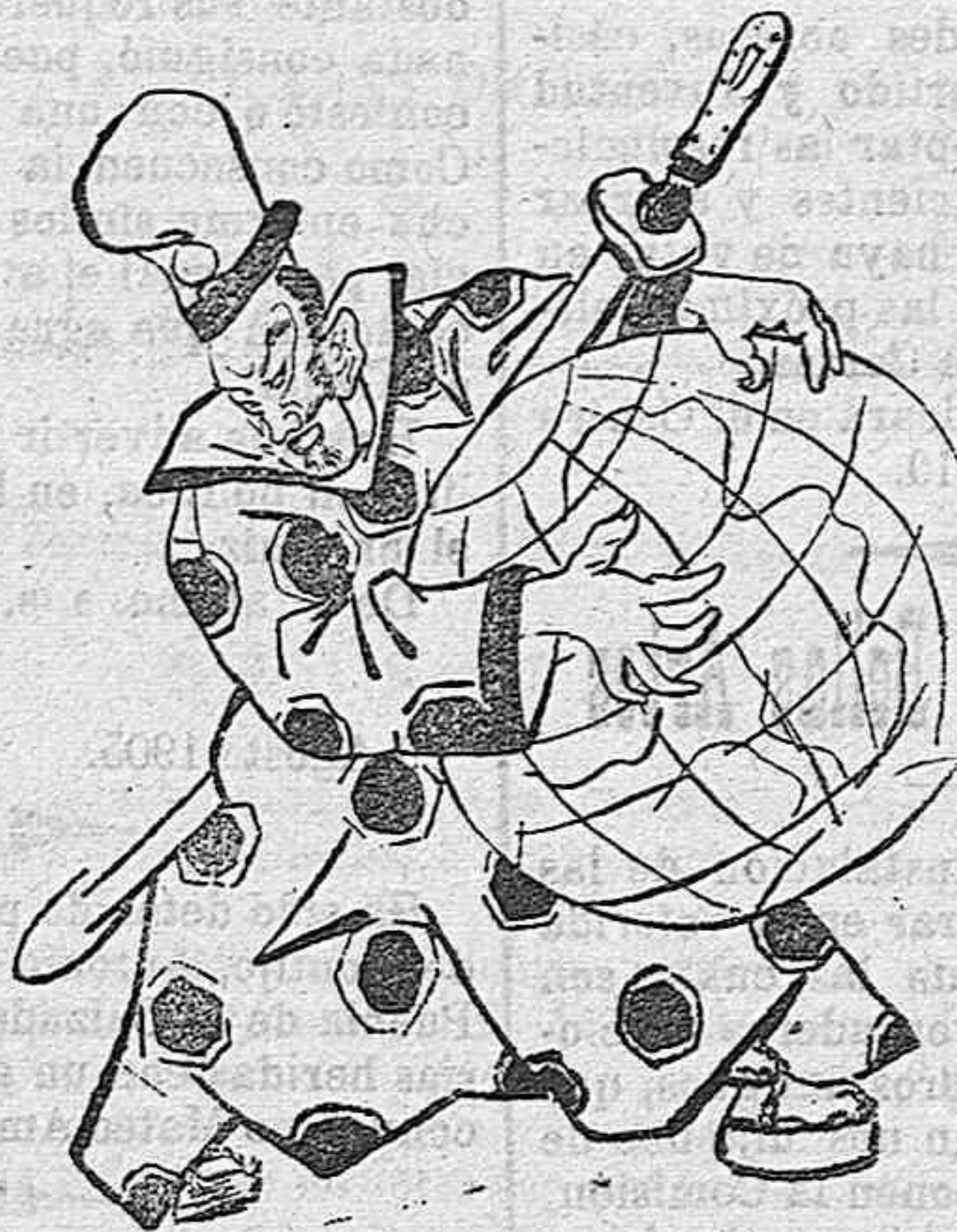
EL MUNDO DOMINADO.—(Sueño japonés de una noche de verano).