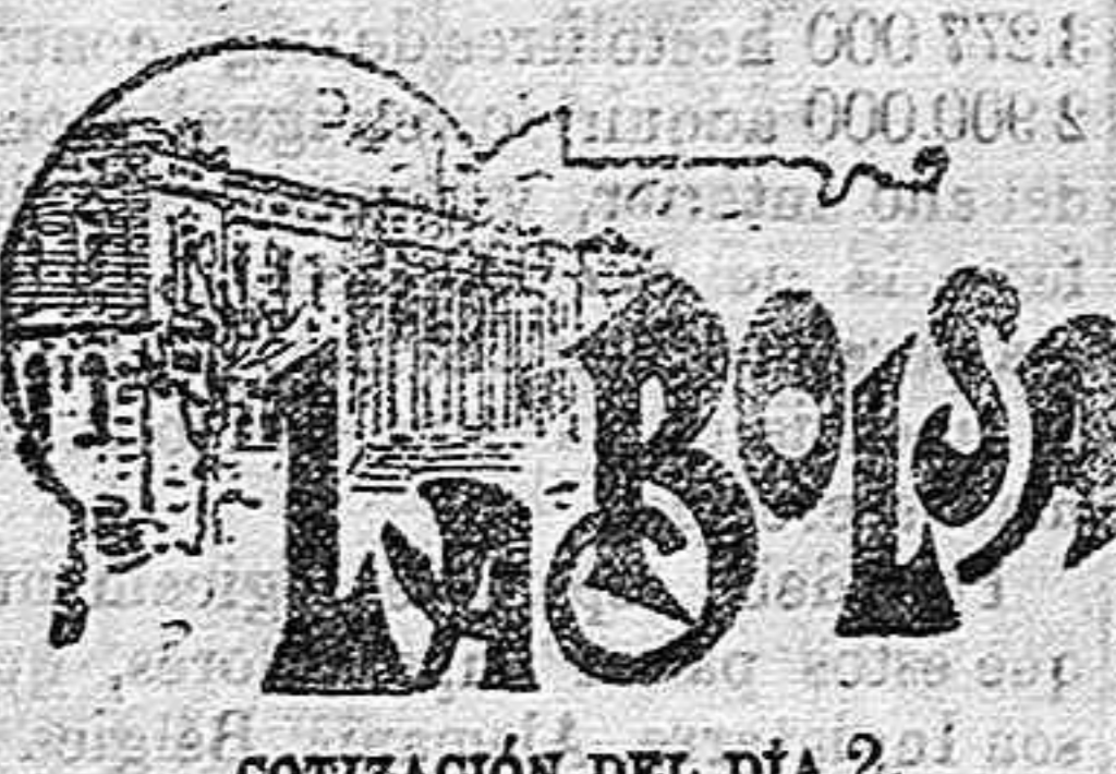
COTIZACIÓN DEL DÍA 2.

Una botella de prueba gratis por correo a los que envíen 75 céntimos para el franco.