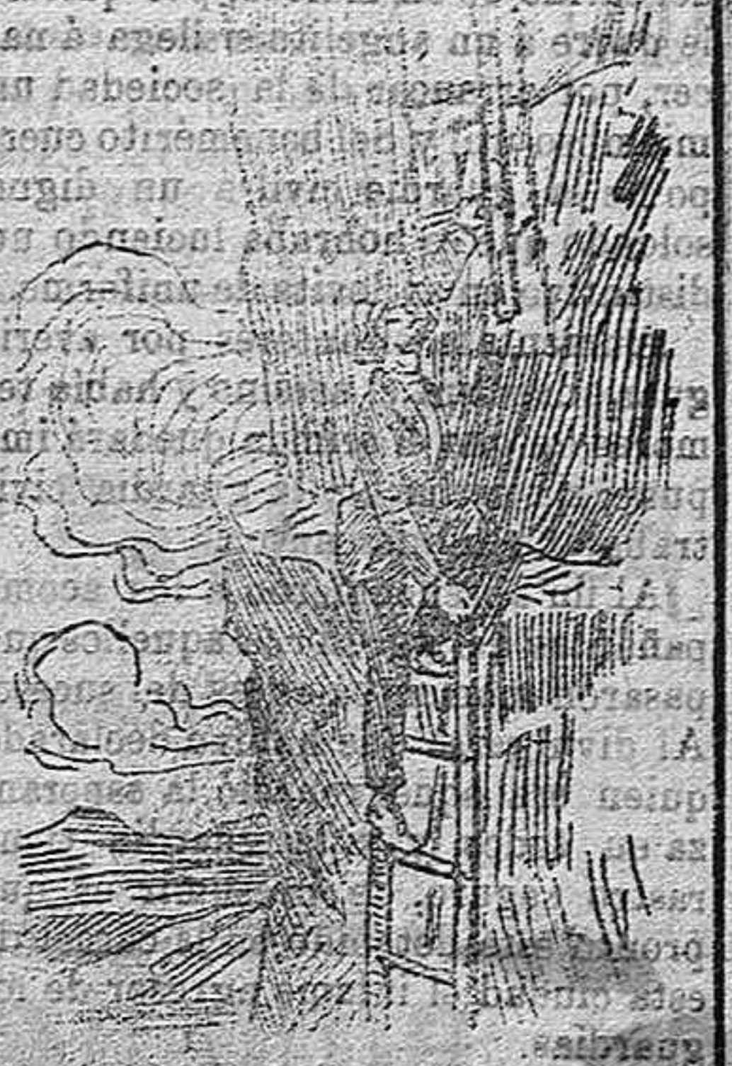
Una ascensión al país de las águilas.

La osadía de algunos de los turis- tas que con frecuencia visitan las montañas de Tesalia no reconoce lí- mites.