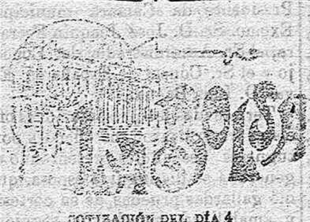
COTIZACIÓN DEL DÍA 4