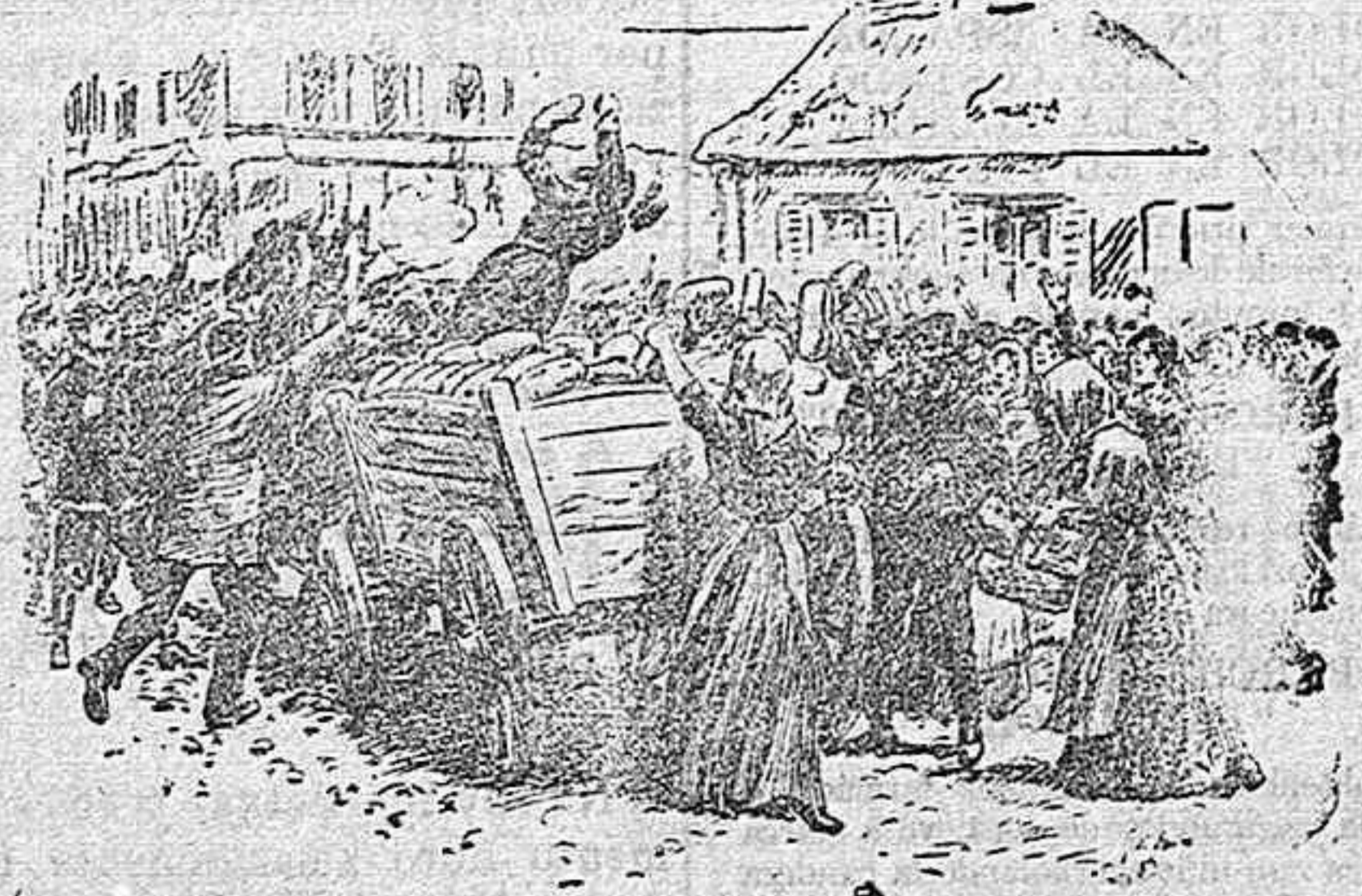
Asalto por el pueblo, en Varsovia, de un carro cargado de pan para el ejército.

mana no trata de precipitar los acontecimientos.