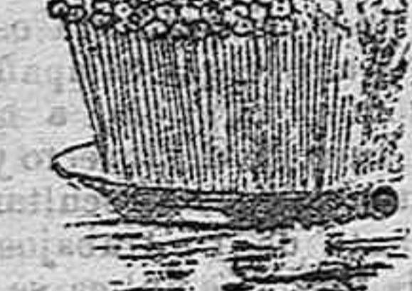
La salvia de Miosotis .

Para ejecutar el experimento que representa nuestro dibujo se llena de agua pura un plato ó una salvia, (fig. 2.)