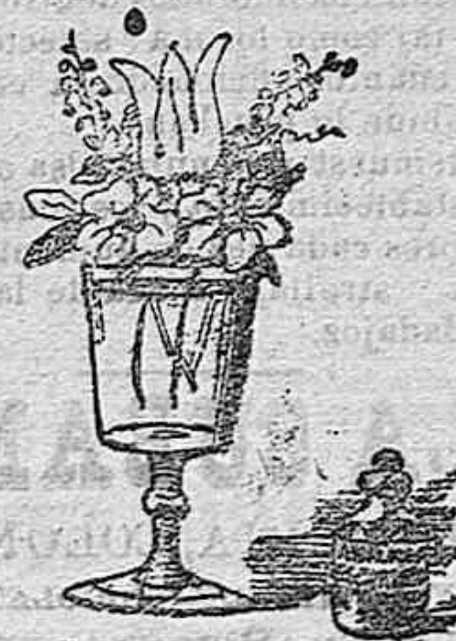
El lirio, rosa.

Este experimento es sumamente curioso y de un bonito efecto decorativo.