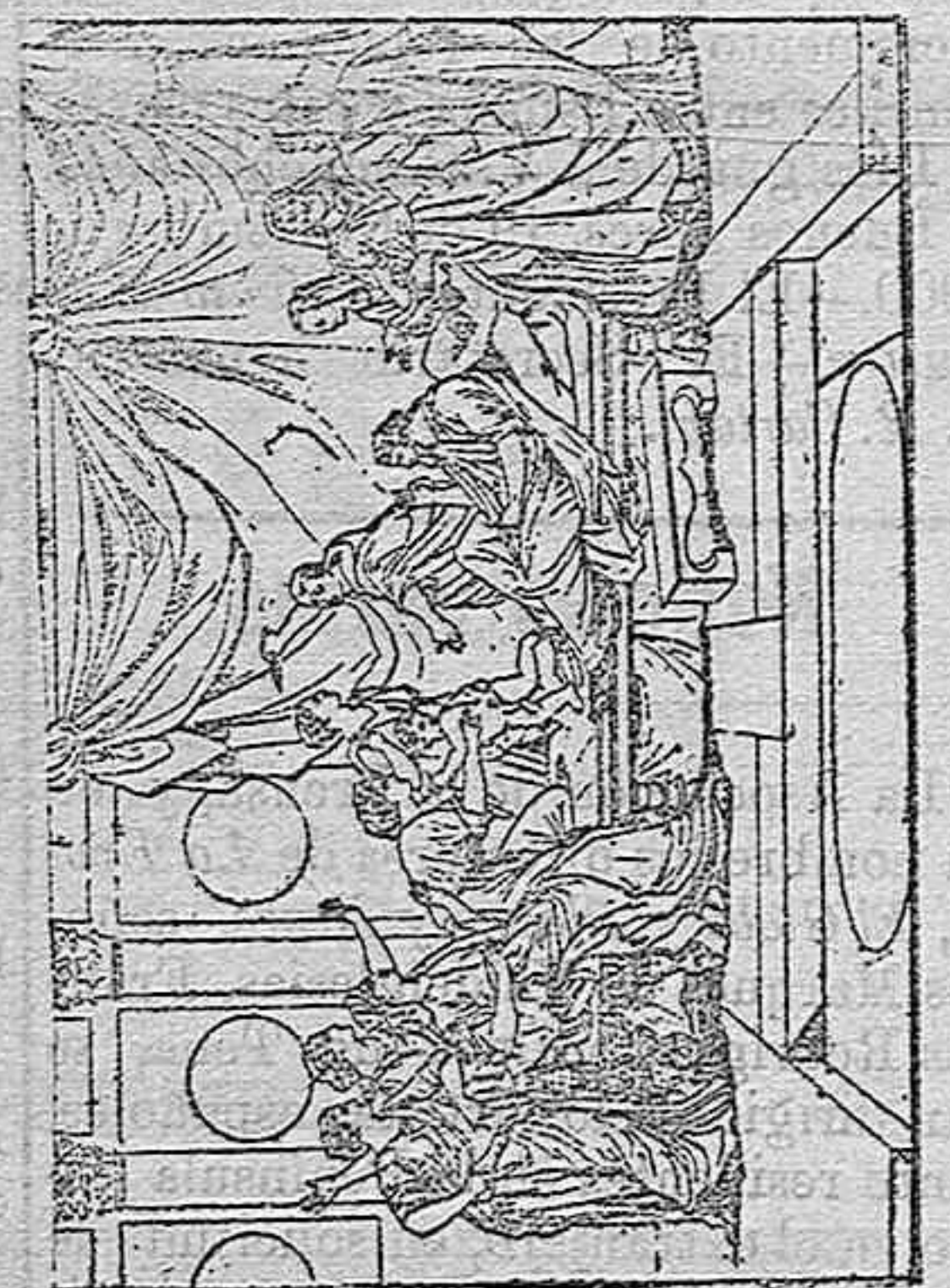
Moisés niño hollando la Corona de Egipto.

El asunto de este cuadro está tomado de las "Antigüedades judaicas", de Flavio Josefo, el cual, hablando de Moisés, dice: "que siendo aquél niño de tres años, la princesa Thermutis le adoptó y lo presentó á Faraón, padre de ella, diciéndole que desearía ver al niño en el trono de Egipto; y que Faraón por complacerla, colocó la corona en la cabeza de Moisés; porque habiéndosele quitado éste y pisándola, uno de los sacerdotes que presenció la acción, tomándolo por un mal augurio, quiso matar al niño."