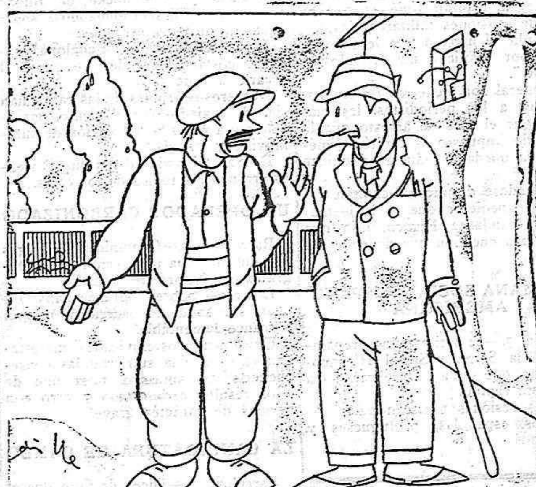
—Entrar en la jaula del león es sen cillísimo. Yo entro todos los días para darle de comer. —¿Y no le tiene usted miedo? —No, porque cuando yo entro en la jaula, el león está en otra.