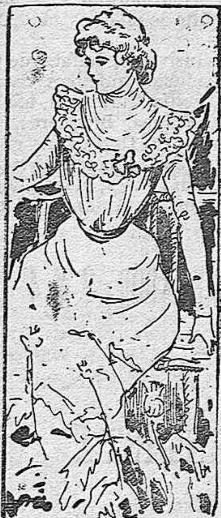
BLUSA PARA SEÑORITA

Modelos exclusivos para nuestras lectoras de los Grandes almacenes de EL SIGLO, Barcelona