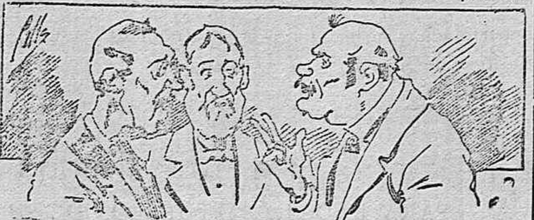
Abominan á nuestros libros....., pero los compran.

Todas las personas de gusto, curiosas é ilustradas deben pedir al Director de LA AVISPA, apartado núm. 8, MADRID, un ejemplar que se remite gratis y franqueado. Esta Revista Enciclopédica Popular publica recreaciones científicas, recetas de cocina, repostería, confitería, vinos, licores, pinturas, barnices, betunes y fórmulas para toda clase de industria, y cuantas noticias y conocimientos puedan ser beneficiosos. Cuenta además con buenos grabados, parte literaria excelente; da regalos mensuales á sus lectores con la Lotería Nacional y participaciones en la misma, á cuyo efecto compra todos los sorteos, y en una de las Administraciones más afortunadas por la suerte, billetes enteros. La suscripción y los números que se nos pidan se sirven gratuitamente á correo vuelto y franqueados, con sólo indicar el nombre y dirección del que lo desea en sobre dirigido al Sr. Administrador de