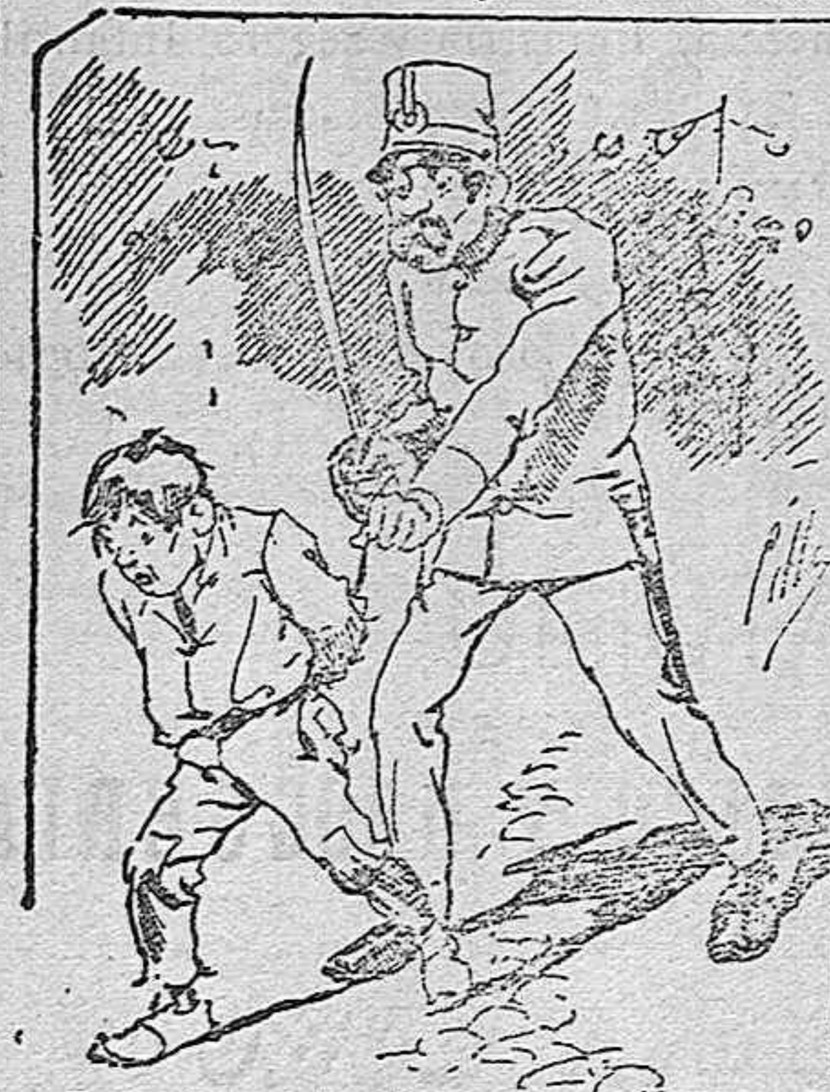
Tratamiento de la policía á nue tres vendedores cuando el número pic.....