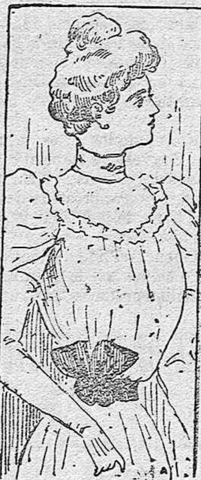
TRAJE PARA TEATRO

La blusa que en este dibujo damos á conocer se confecciona con glasé de un color liso. Para que esta prenda resulte elegante se la adorna con un ancho volante de encaje, colocado de modo que abarcando el pecho y espalda, cubra también las hombreras. En este volante y á la parte izquierda del pecho se coloca un lazo de terciopelo. El cinturón para esta blusa será también de terciopelo.