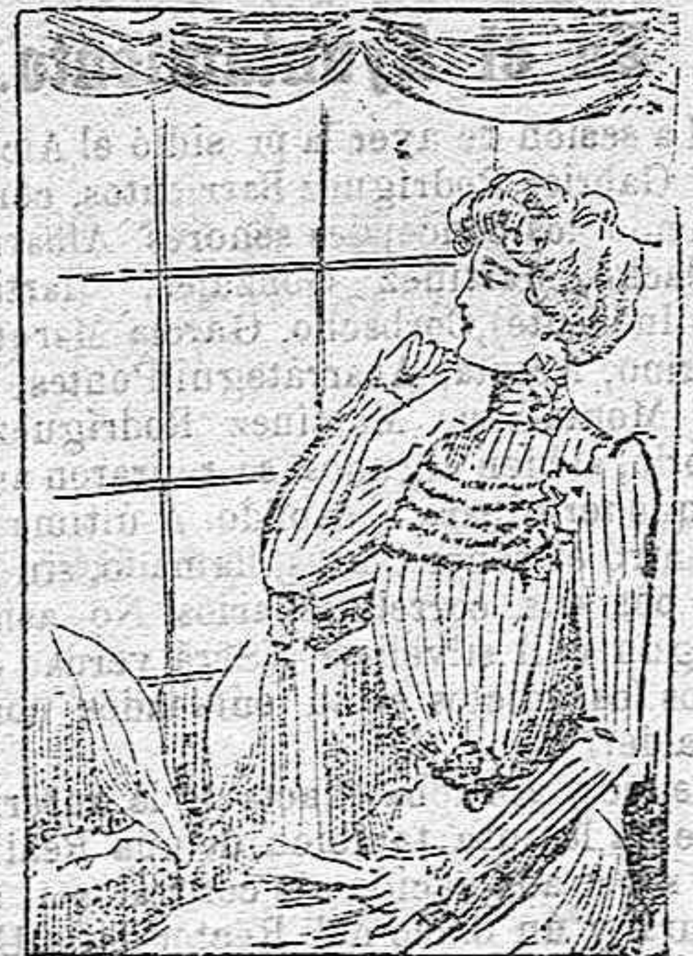
BLUSA PARA PRIMAVERA Es de glasé, color liso y confeccionada

Modelos exclusivos para nuestras lectoras de los Grandes almacenes de EL SIGLO, Barcelona