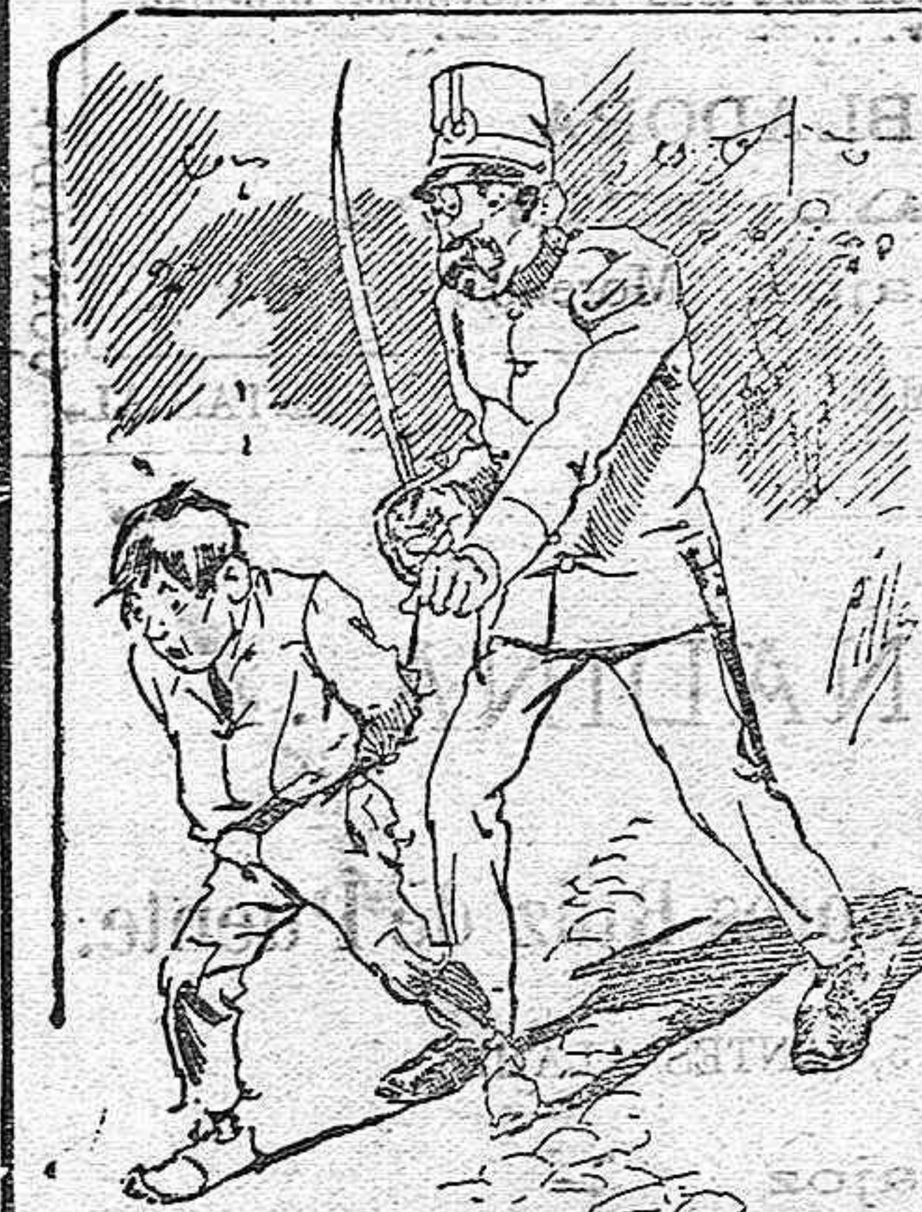
Tratamientos de la policía á nue tres vendedores cuando el número pica....