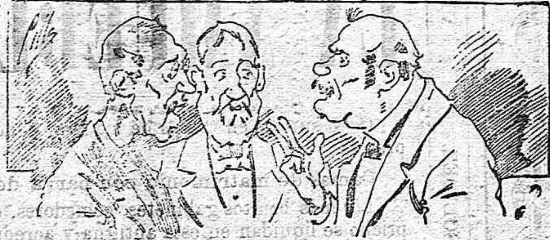
Abomigan á nuestros libros..... pero los compran.

Todas las páginas de gusto, curiosas é ilustradas cubren el programa de LA AVISPA, apartado núm. 8, un ejemplar que se remite gratis y franqueado. Esta Revista Enciclopédica Popular publica recreaciones científicas, recetas de cocina, repostería, confitería, vinos, licores, pinturas, barnices, betunes y fórmulas para toda clase de industria, y cuantas noticias y conocimientos puedan ser beneficiosos. Cuenta además con buenos grabados, parte literaria excelente, da regalos mensuales á sus lectores con la Lotería Nacional y participaciones en la misma, á cuyo efecto compra todos los sorteos, y en una de las Administraciones más afortunadas por la suerte, billetes enteros. La suscripción y los números que se nos pidan se sirven gratuitamente á correo vuelto y franqueados, con sólo indicar el nombre y dirección del que lo desea en sobre dirigido al Sr. Administrador de