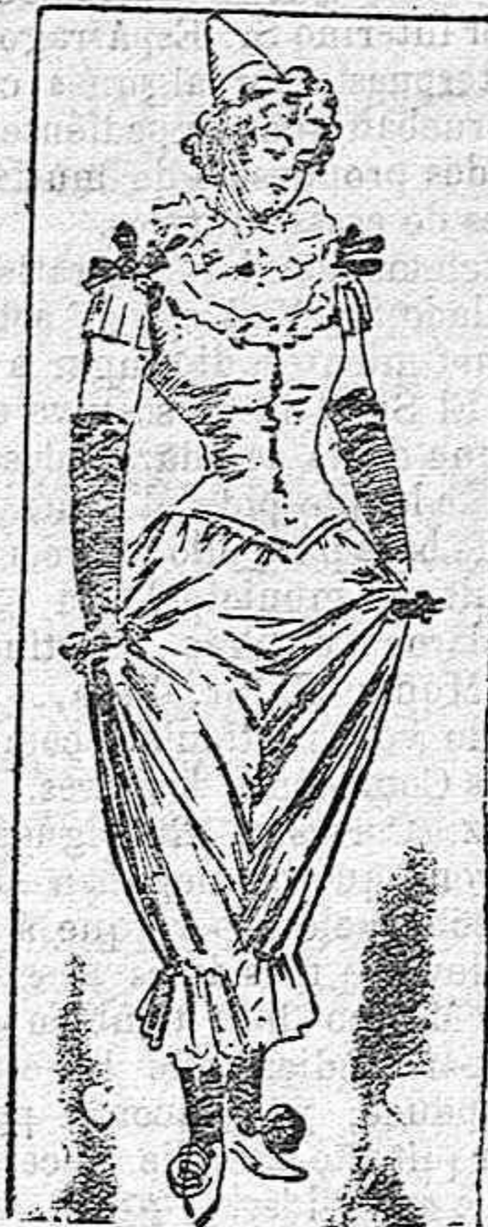
DISFRAZ DE PIERROT

Modelos exclusivos para nuestras lectoras de los grandes almacenes de EL SIGLO, Barcelona.