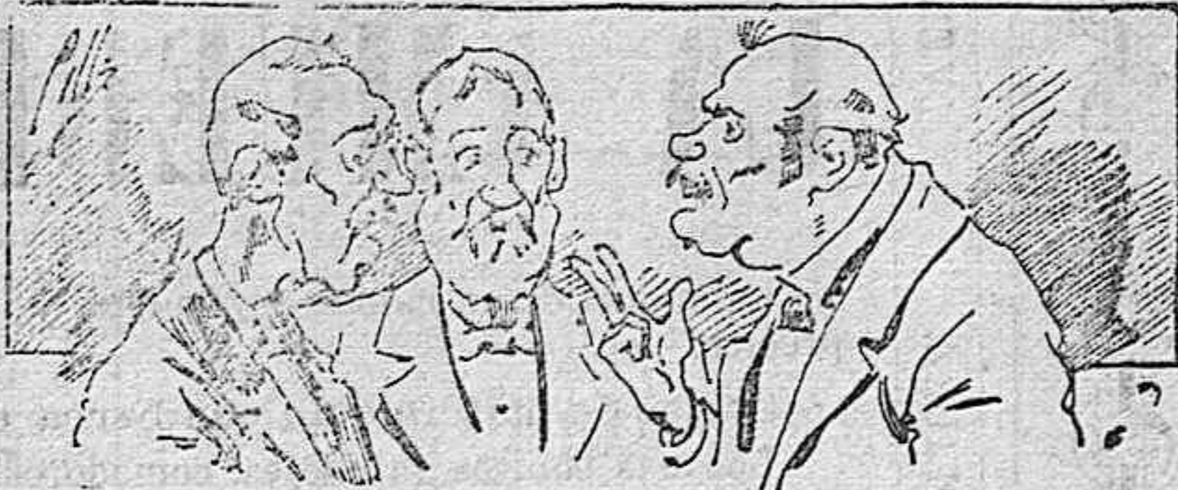
Abominan á nuestros libros....., pero los compran.

Todas las páginas de gusto, curiosas é ilustradas debe ser el director de LA AVISPA, apartado núm. 8, en un ejemplar que se remite gratis y franqueado esta Enciclopedia Popular publica recreaciones científicas, recetas de cocina, repostería, confitería, vinos, colores, pinturas, barnices, betunes y fórmulas para toda clase de industria, y cuantas noticias y conocimientos puedan ser beneficiosos. Cuenta además con buenos grabados, parte literaria excelente; da regalos mensuales á sus lectores con la Lotería Nacional y participaciones en la misma, á cuyo efecto compra todos los sorteos, y en una de las Administraciones más afortunadas por la suerte, billetes enteros. La suscripción y los números que se nos pidan se sirven gratuitamente á correo vuelto y franqueados, con sólo indicar el nombre y dirección del que lo desea en sobre dirigido al Sr. Administrador de