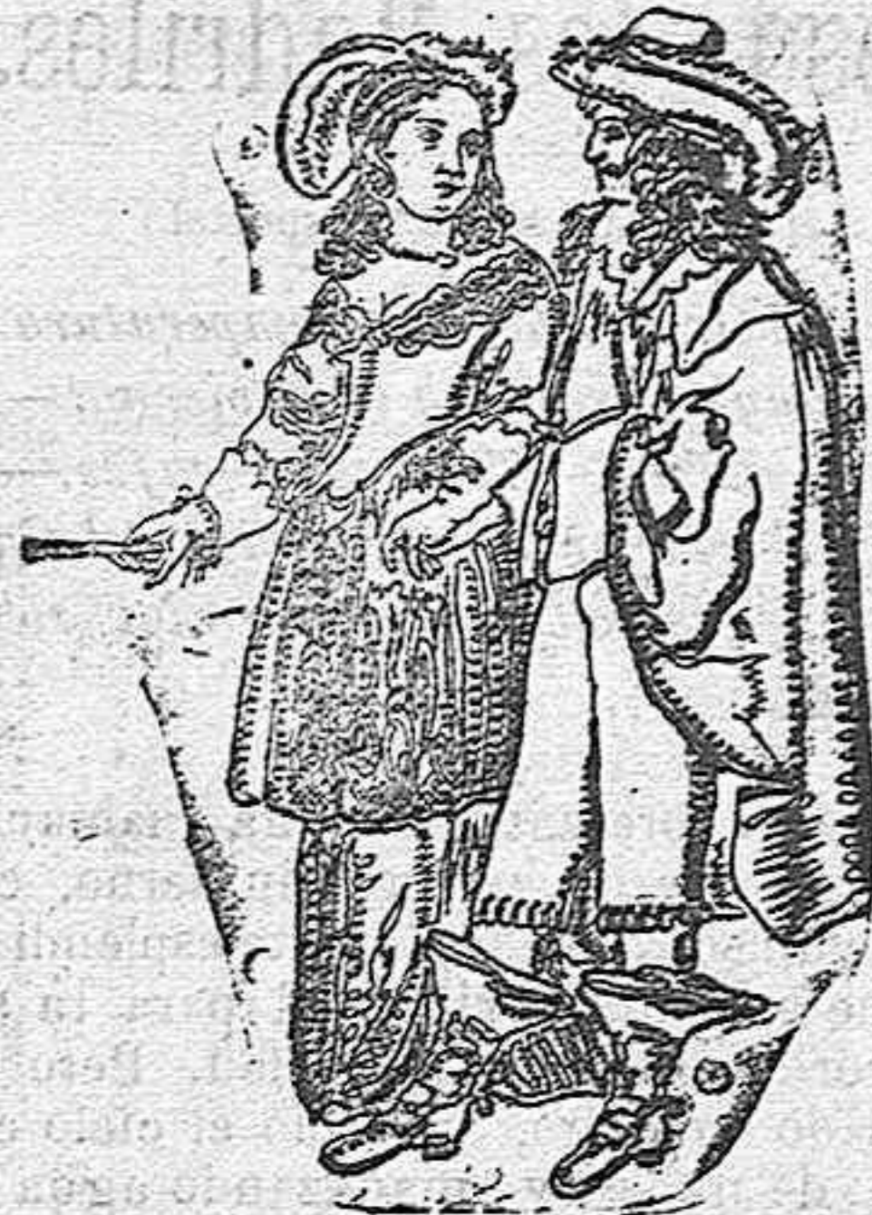
El pintor Rubens y su esposa

El curioso dibujo que aquí reproducimos, forma parte de un manuscrito del siglo XVII, descubierto casualmente en 1850 entre unos escombros, en Batignoles. Hoy se conserva en la Biblioteca Nacional de París, en el departamento de estampas. El libro es un tomo en cuarto ordinario. Su encuadernación llama la atención por estar hecha con tela de satén rosa y llena la tela de figuras.