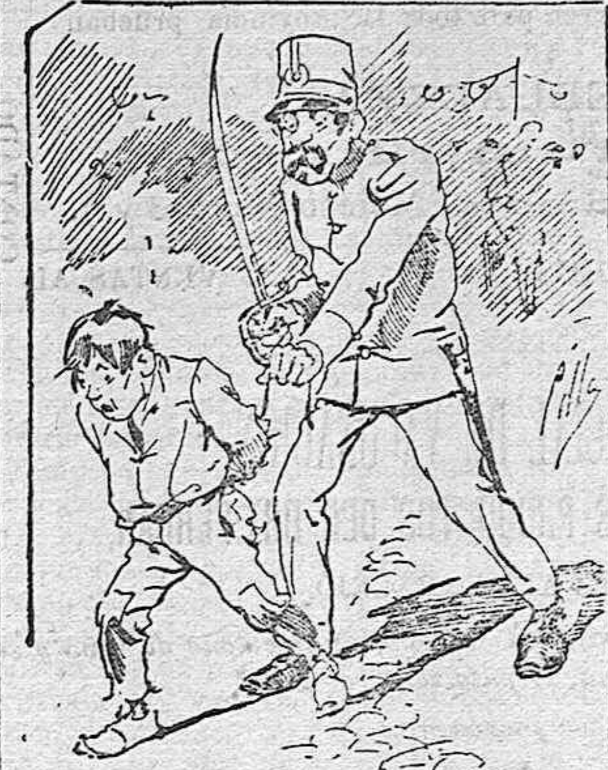
Tratamientos de la policía á nue tres vendedores cuando el número pica.....