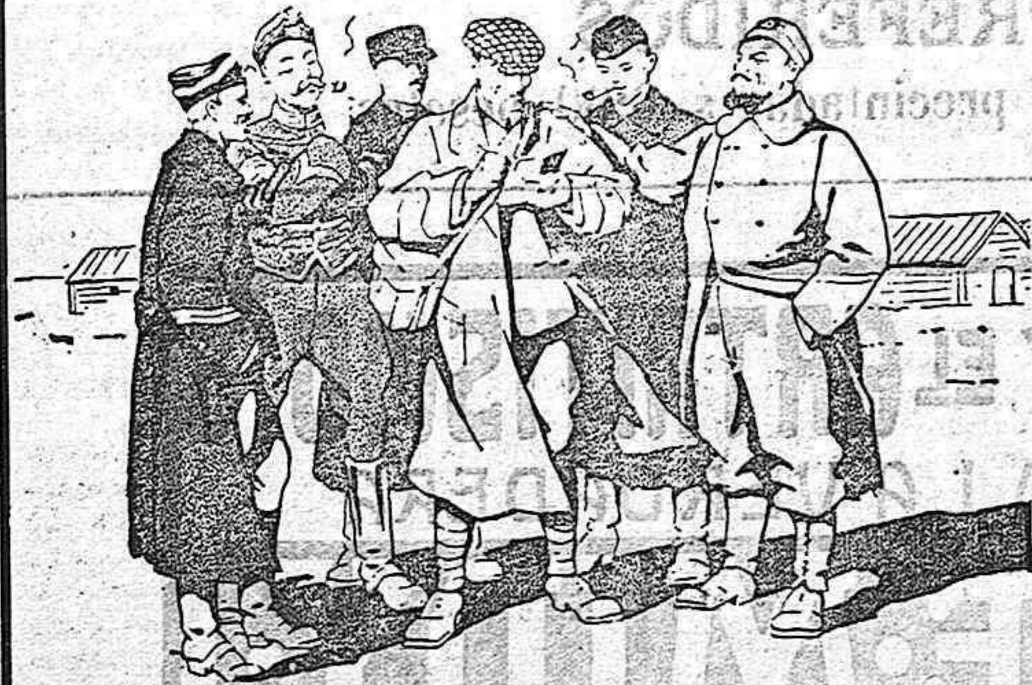
M.W*** reporter holandés interrogando á los prisioneros del campamento de Harderwyk.

Sabido es que después de luchar heroicamente contra el invasor, sucumbiendo bajo el número después de luchar uno contra veinte, algunas tropas belgas evitaron el caer prisioneras pasando la frontera y refugiándose en Holanda. Conforme á las leyes internacionales estas tropas fueron internadas en campamentos, particularmente en el de Harderwyk. Entre estos soldados había muchos que si bien no estaban heridos se encontraban muy quebrantados de salud, á consecuencia de las fatigas de la campaña y también como resultado del choque moral sufrido. Han sido atendidos con esmero y se han restablecido por completo. Hemos tenido una gran satisfacción al saber que muchos se han curado merced al tratamiento por las Píldoras Pink, que en Holanda disfrutaron de tanto favor como en España.