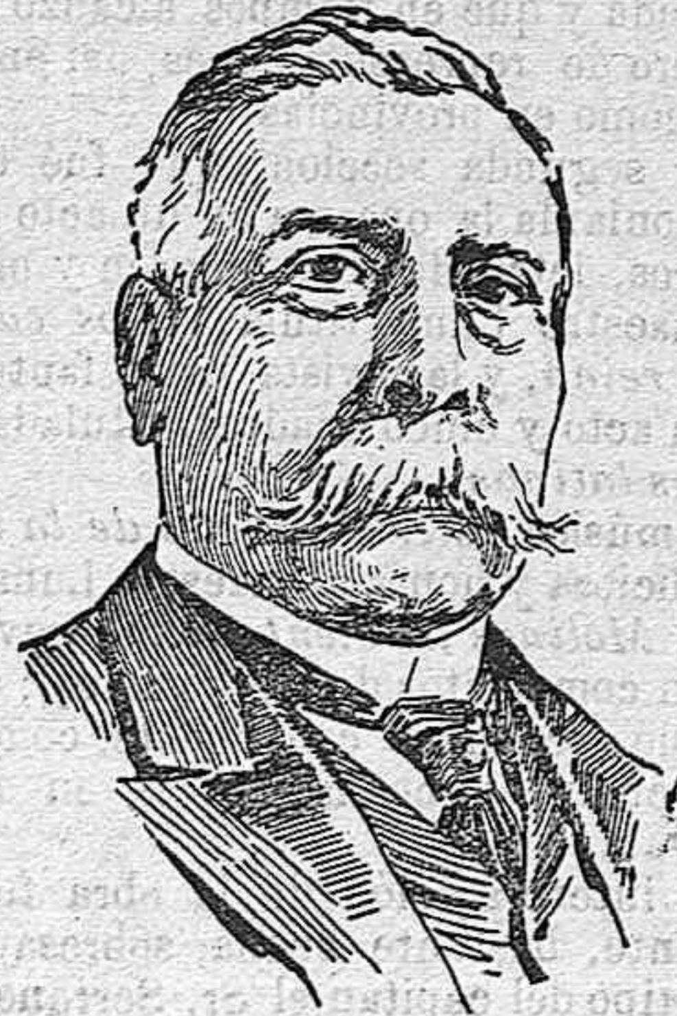
Don Porfirio Díaz, ex presidente de la República de Méjico, recientemente fallecido en París.