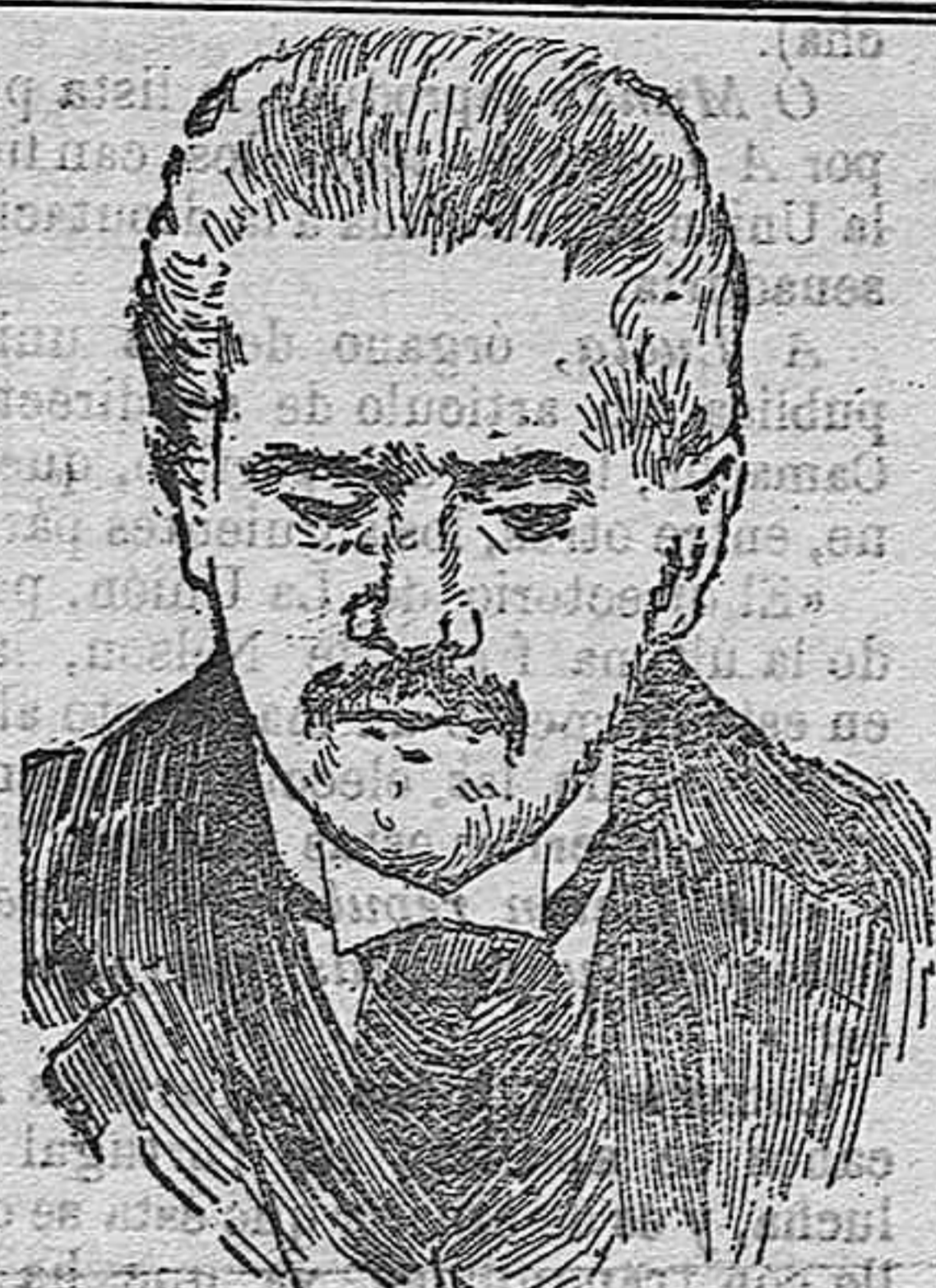
TEÓFILO BRAGA nuevo presidente de la República portuguesa