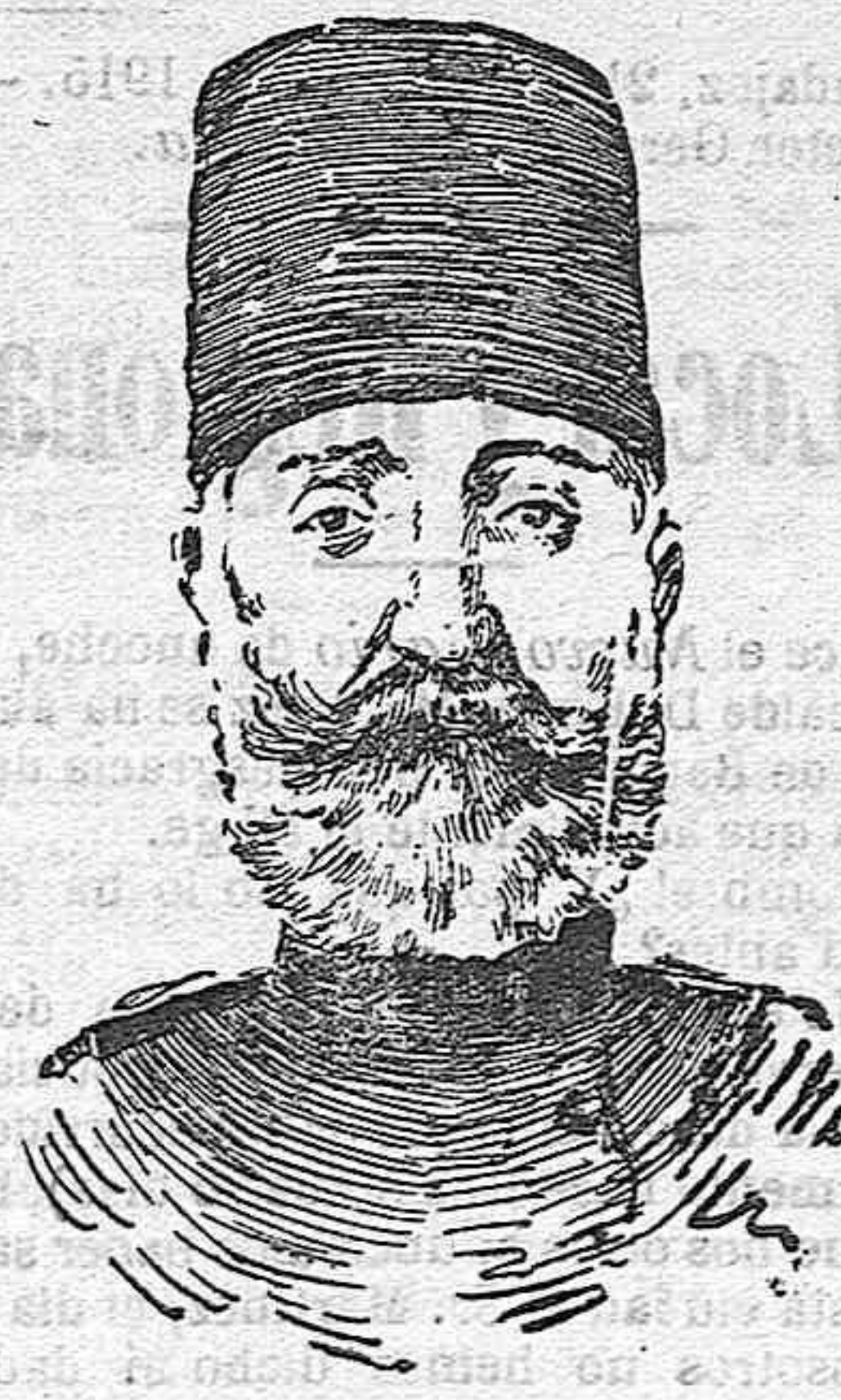
El general Chukri Pachá, célebre por la defensa que hizo de Andrinópolis y hecho prisionero por los rusos en Ardahan