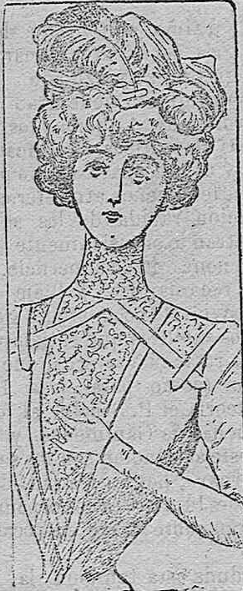
Toca para señorita.

Modelos exclusivos para nuestras lectoras, de los grandes almacenes de EL SIGLO, Barcelona.