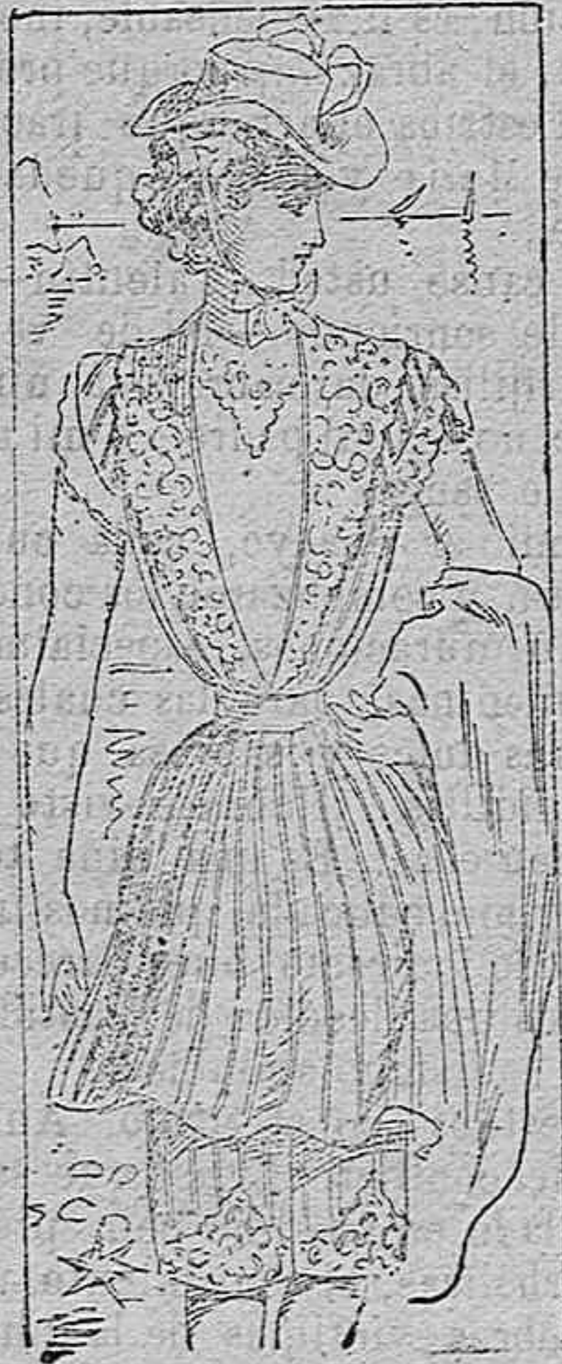
Traje para baño

Modelos exclusivos para nuestras lectoras, de los grandes almacenes de EL SIGLO, Barcelona.