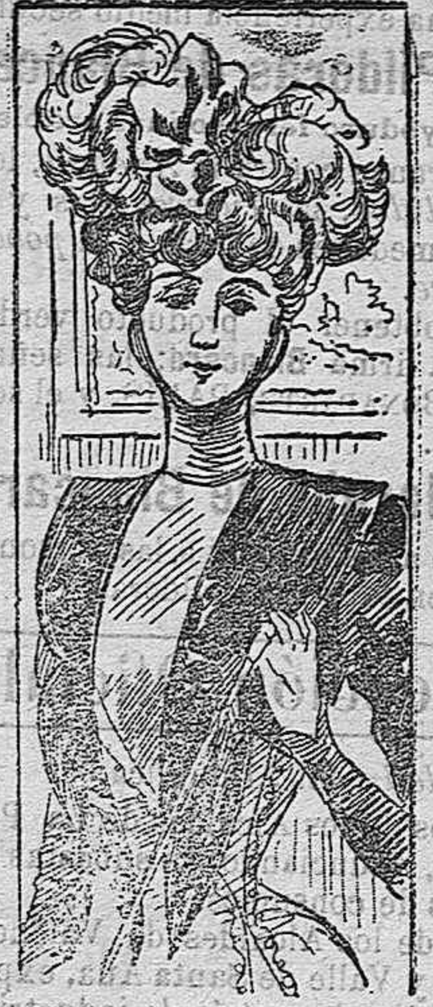
Traje para paseo.

El que nuestro dibujo representa es de forma princesa y se confecciona con lana. Consta de un cuerpo de construcción sencilla, aun cuando el corte de éste requiere el mayor esmero, á fin de que las grandes solapas de moiré que constituyen su principal adorno tengan la debida simetría. También se adorna el cuerpo con un bordado que baja á la falda, siendo ésta abierta y de forma redonda. El cuello alto, de moiré y sin ningún adorno.