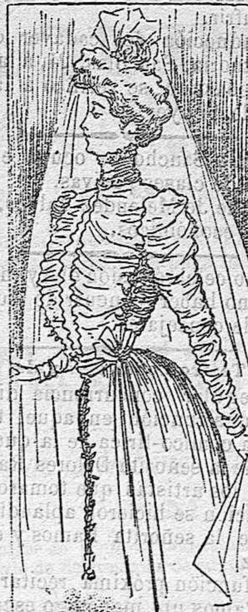
Traje para novia.

Modelos exclusivos para nuestras lectoras, de los grandes almacenes de EL SIGLO, Barcelona (1).