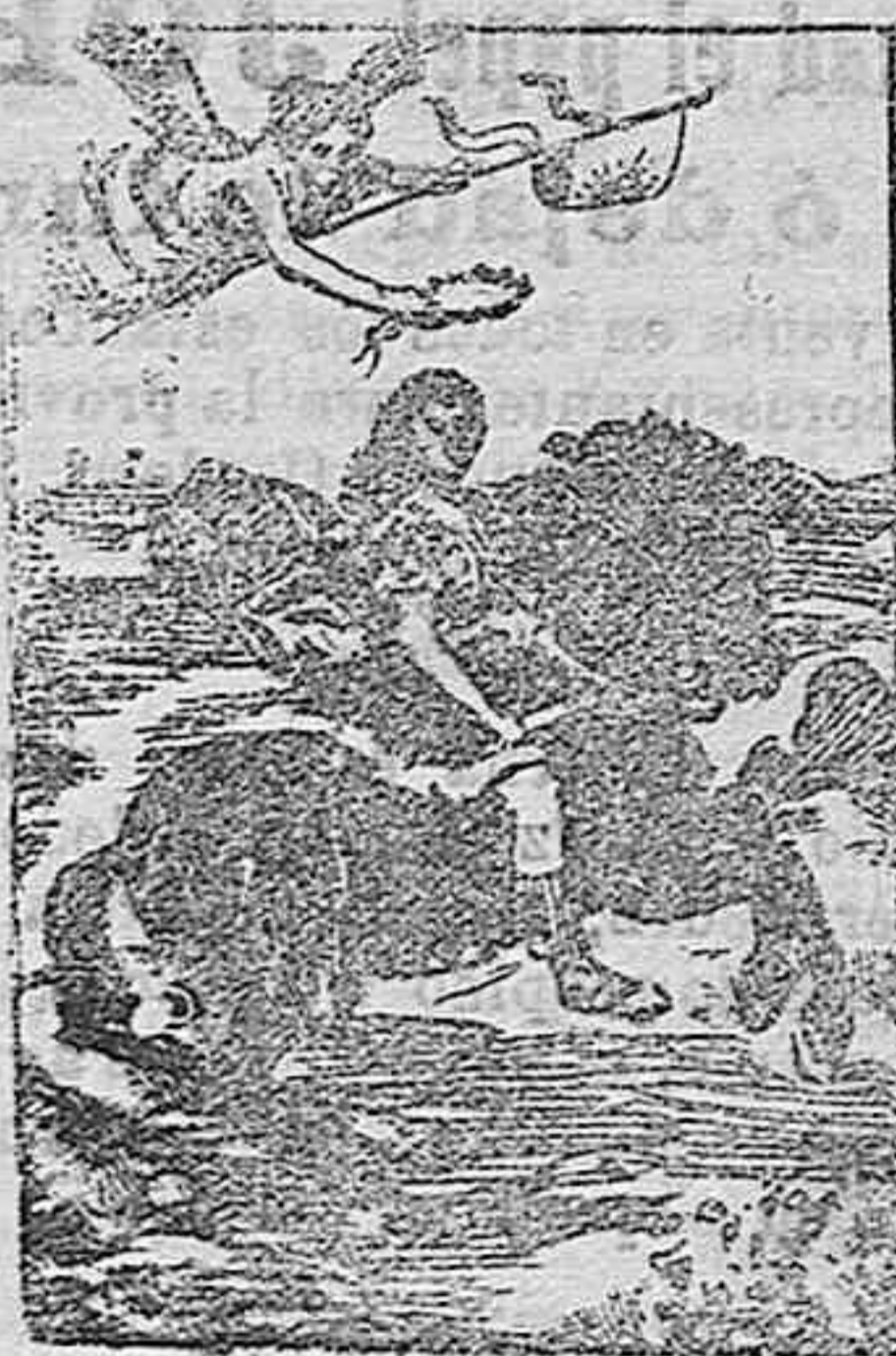
Luis XIV, rey de Francia

gráfico; al lado de revelantes rasgos del arte francés, representados en su mayoría, encuéntrase algunas pinturas de origen italiano que por su belleza y el interés que despiertan son objeto de general admiración.