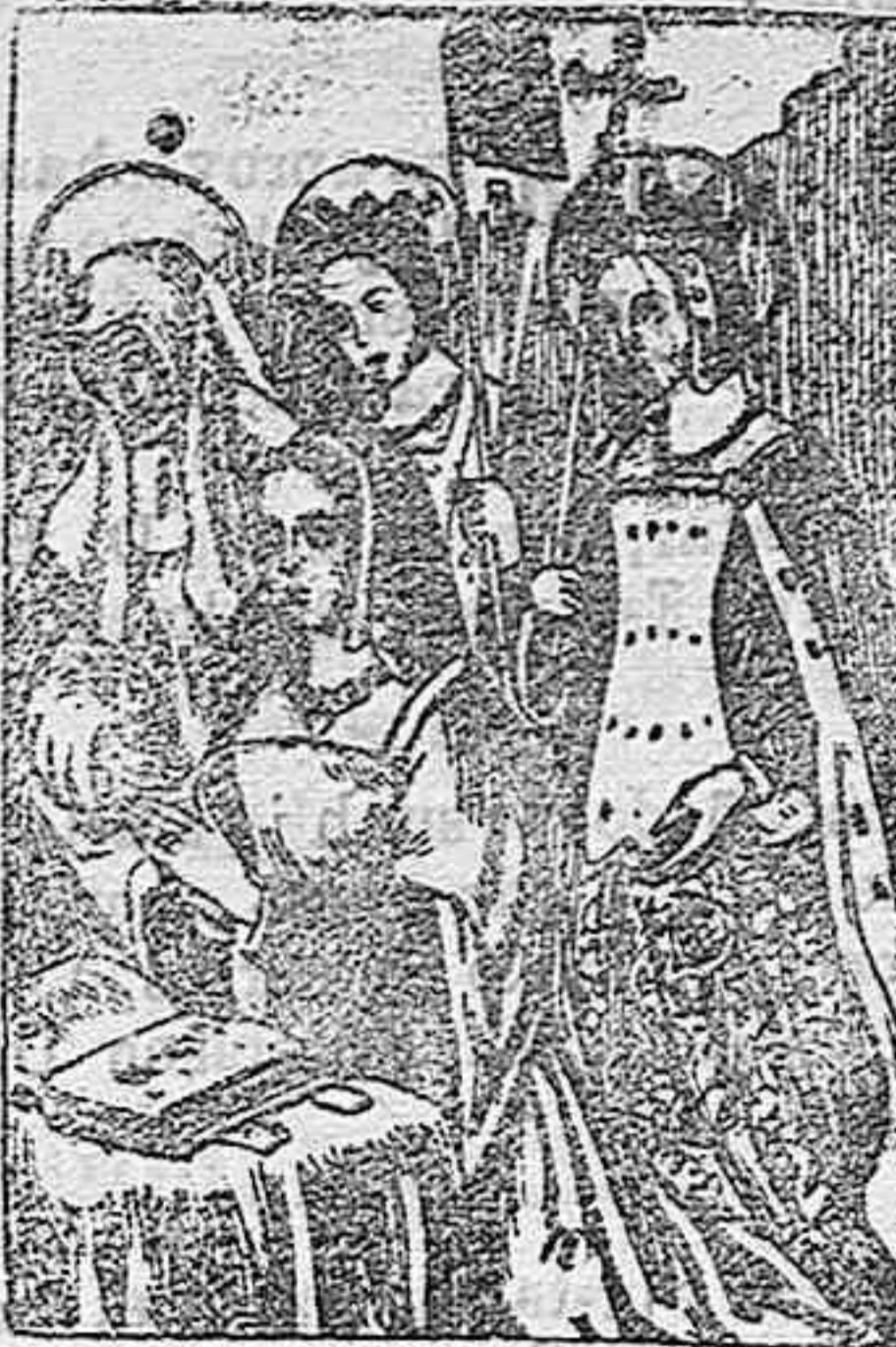
Ana de Bretaña, reina de Francia.

El retrato del rey á caballo y en traje de general romano, aun cuando no está firmado, se atribuye al célebre pintor Petitot.