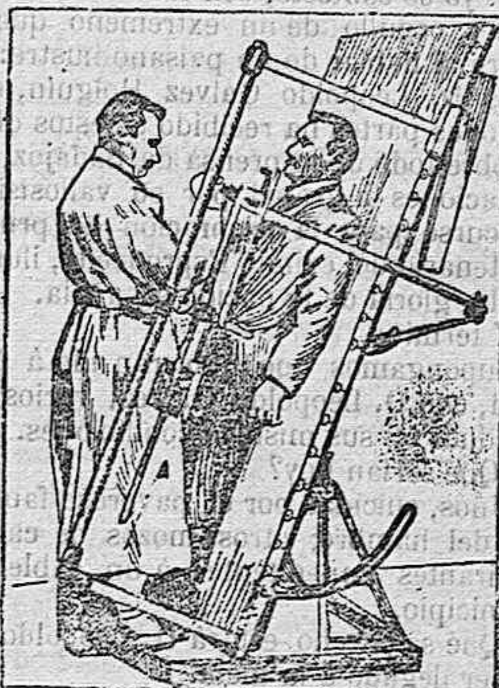
Observaciones ortoradiográficas del volúmen del corazón

Mas el descubrimiento no aparecía del todo claro; para impresionarse debidamente la placa fotográfica, se requería un término de tres horas de exposición. Esto hizo que todos los físicos se dedicaran al estudio del problema de la reducción del tiempo, hasta llegar á la impresión en una fracción de segundo.