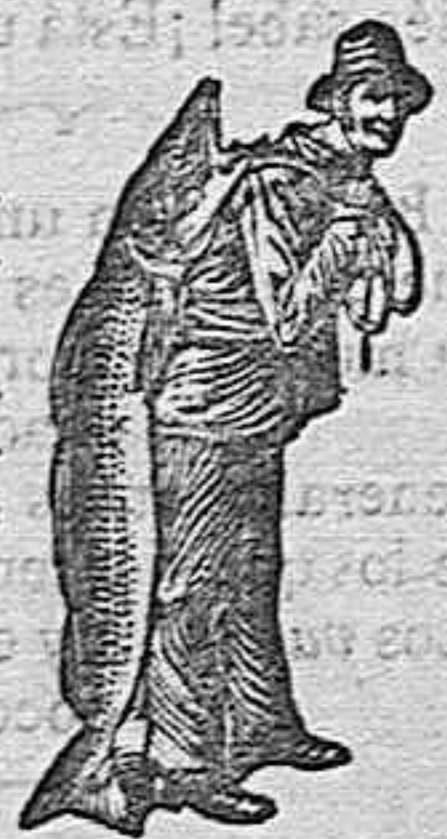
Obténase siempre la Emulsión con esta marca «El Pescador» marca del procedimiento SCOTT.

porque ninguna otra está compuesta de los mismos materiales puros y vigorizantes (haciendo caso omiso del coste) por el procedimiento único de SCOTT, que asegura la perfecta asimilación. Sin «el pescador con el pescado» en el envoltorio, la emulsión no es legítima de SCOTT, que hizo otro hombre del Sargento Gallego, y que hará lo mismo con V. Empiece á usar la de SCOTT hoy, enviando á D. Carlos Marés, Calle de Valencia 333 Barcelona, 75 cts. en sellos, para que le remita una muestra gratis. En todas las droguerías y farmacias.