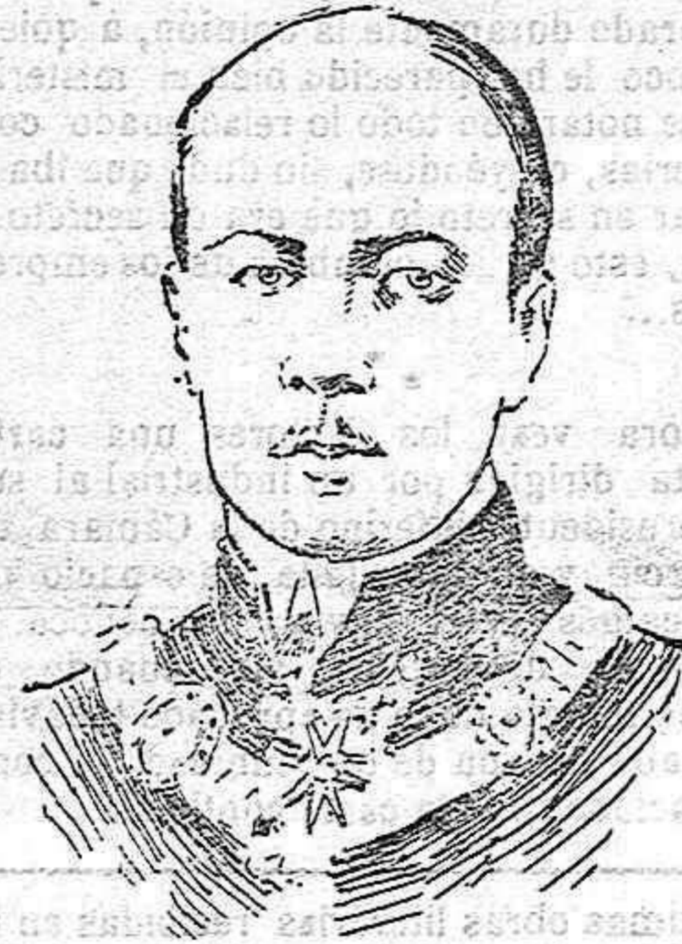
El conde Graf Berchtholds, ministro de Estado de Austria y autor de la nota que ha provocado la guerra.

Mucho nos extraña tal proceder, suponiendo que sea cierto lo que se nos dice, pues los deberes profesionales están por cima de los intereses políticos.