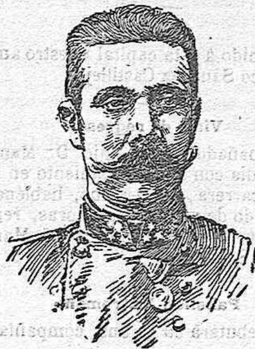
El príncipe heredero de Austria, archiduque Francisco Fernando, asesinado en Sarajevo.