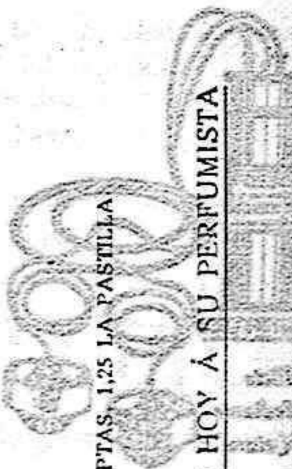
PTAS. 1,25 LA PASTILLA

EL NUEVO JABÓN FLORES DEL CAMPO ES UN PRODUCTO CIENTÍFICO QUE LA PERFUMERIA-FLORALIA OFRECEN A LA COQUETERIA FEMENINA