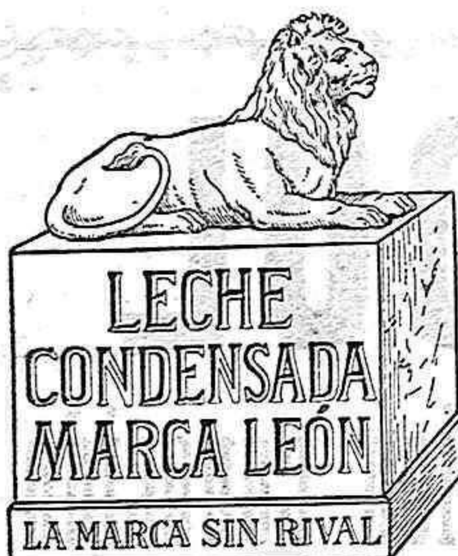
Natura-Milch-Exportgesellschaft Bosch & Co. m. b. H. Waren in Mecklenburg.

La más selecta y sin rival analizada por el doctor Calvet, de Barcelona, garantizándose su pureza, por lo que no se nota lo más mínimo el sabor extraño que tienen otras marcas.