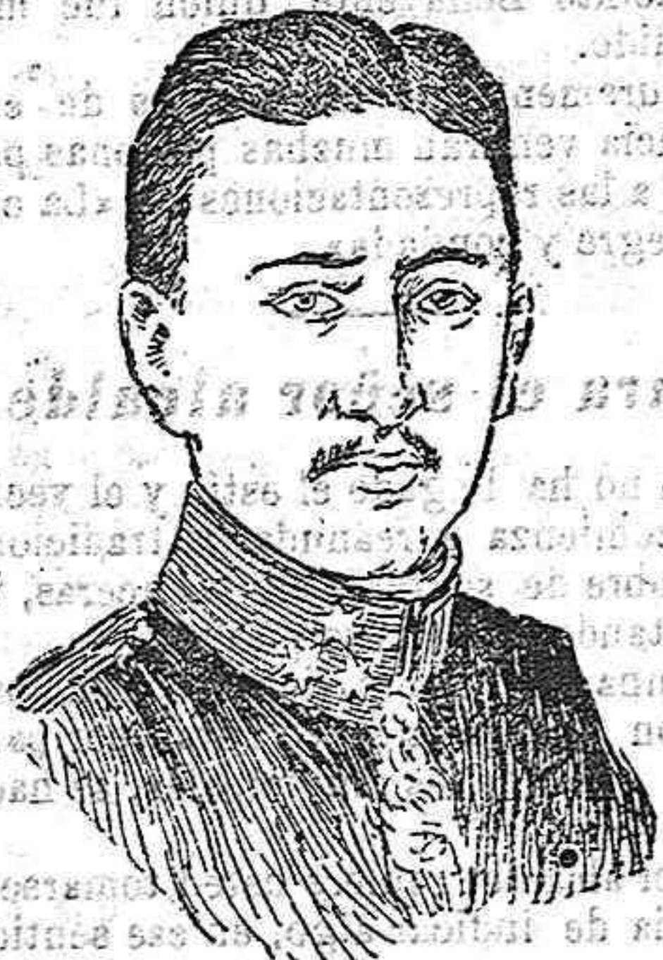
El archiduque heredero de Austria, Carlos Francisco José, bajo cuya dirección se está desarrollando la gran ofensiva en el frente austro-italiano.