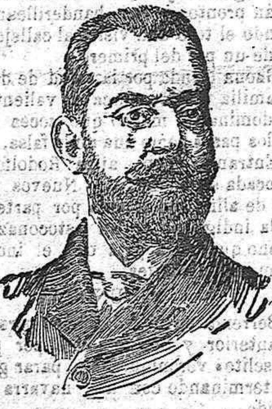
Señor González Besada

Con gran solemnidad se celebró el domingo la recepción en la Real Academia Española del ilustre académico electo D. Augusto González Besada. La docta casa, presentaba el aspecto de las grandes solemnidades ocupando los escaños del estrado los académicos de la Española y otros muchos de las corporaciones hermanas.