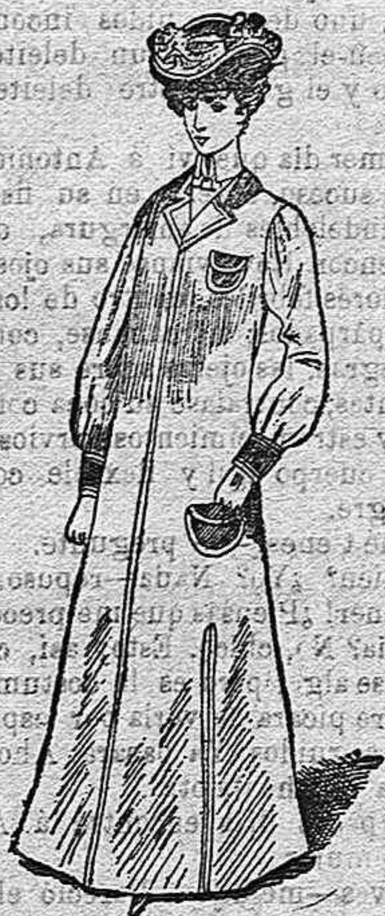
Abriego para viaje.

Por su sencillez nos excusamos detallar su confección. Cubre todo el cuerpo, hasta los pies. Su corte es forma sastre, con solapas, bolsillos y bacamangas de terciopelo. Esta prenda es holgada y sumamente cómoda.