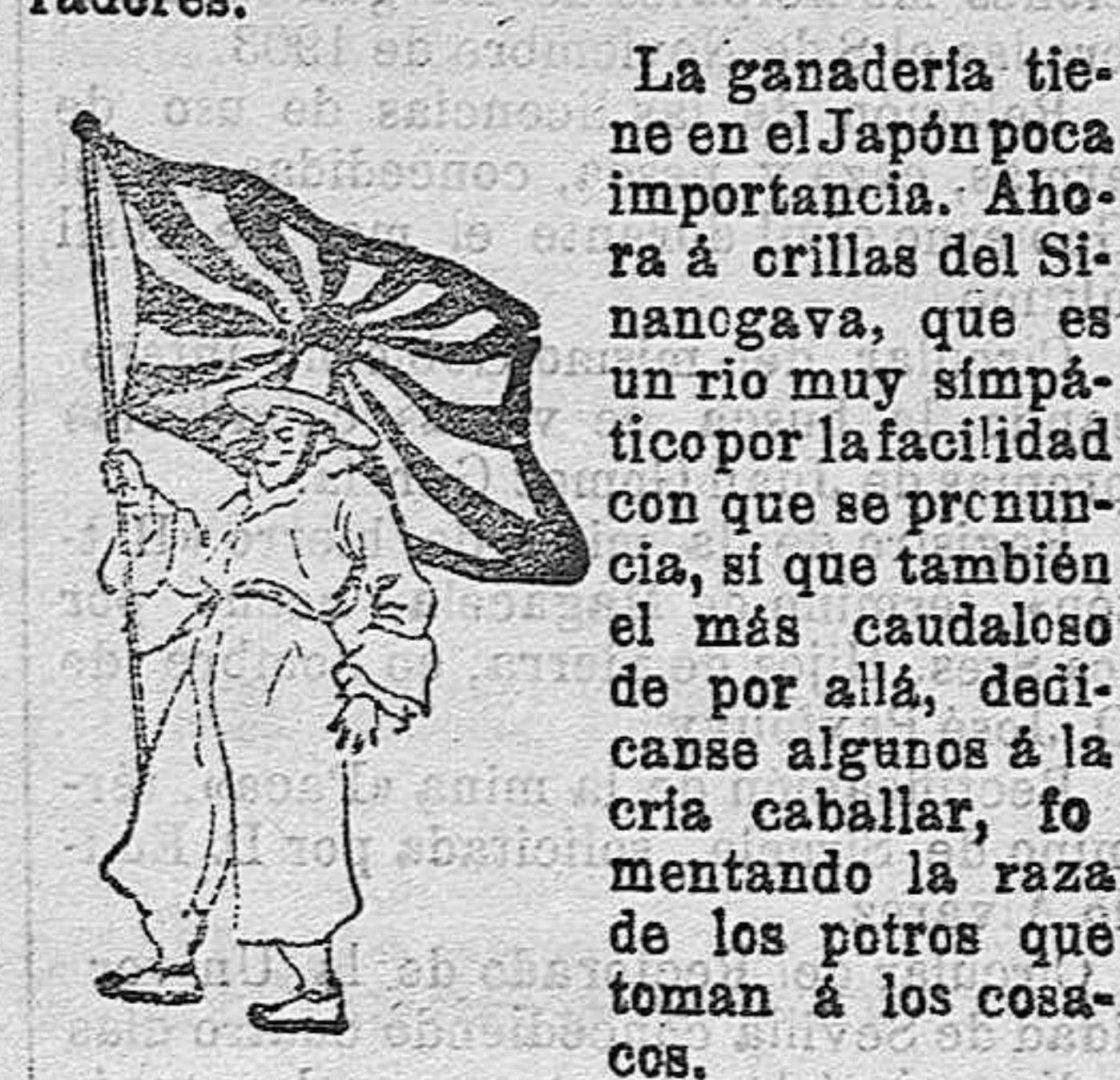
(Del notable y satírico Libro amarillo , recientemente publicado)

La ganadería tiene en el Japón poca importancia. Ahora á crillas del Si-nanogava, que es un río muy simpático por la facilidad con que se pronuncia, si que también el más caudaloso de por allá, dedicanse algunos á la cria caballar, fomentando la raza de los potros que toman á los cosacos.