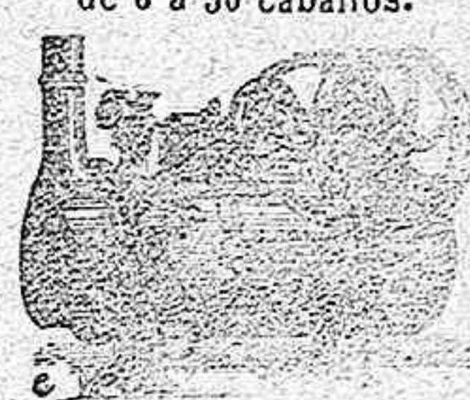
CUATRO DIPLOMAS de honor de 1869 1876.

Envío franco de los prospectos detallados.