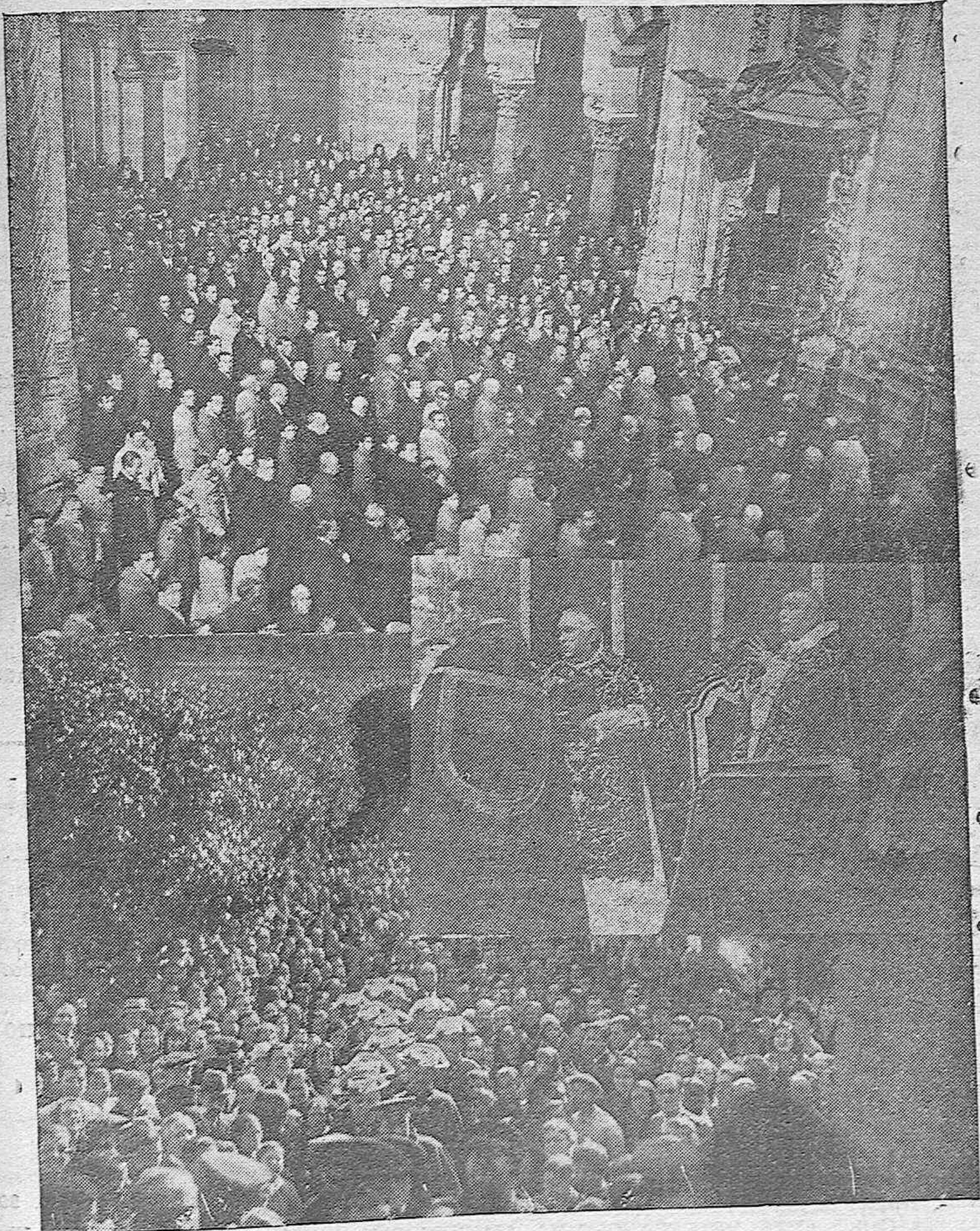
Los funerales por las víctimas de Asturias y Cataluña.—Arriba: Vista de una de las naves de la Catedral durante la ceremonia.—Abajo: Las autoridades y otras personas saliendo de la Mezquita Catedral.—En el centro: El Obispo durante la misa.