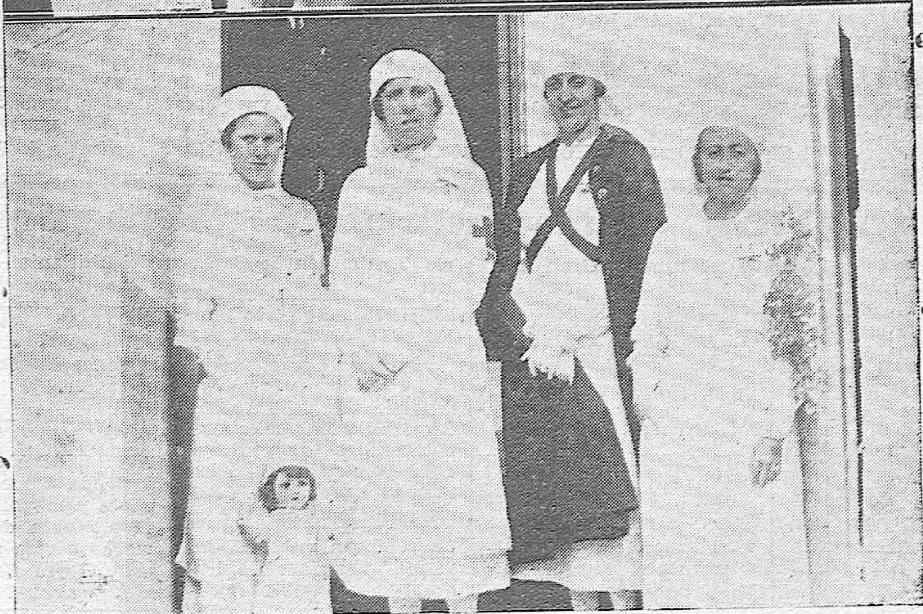
Los momentos de la exposición de las Medallas a las señoritas damas enfermeras voluntarias de la Cruz Roja Española, al terminar el tercero y último curso, cuyo acto tuvo lugar ayer en el Hospital de la benéfica institución en Córdoba.