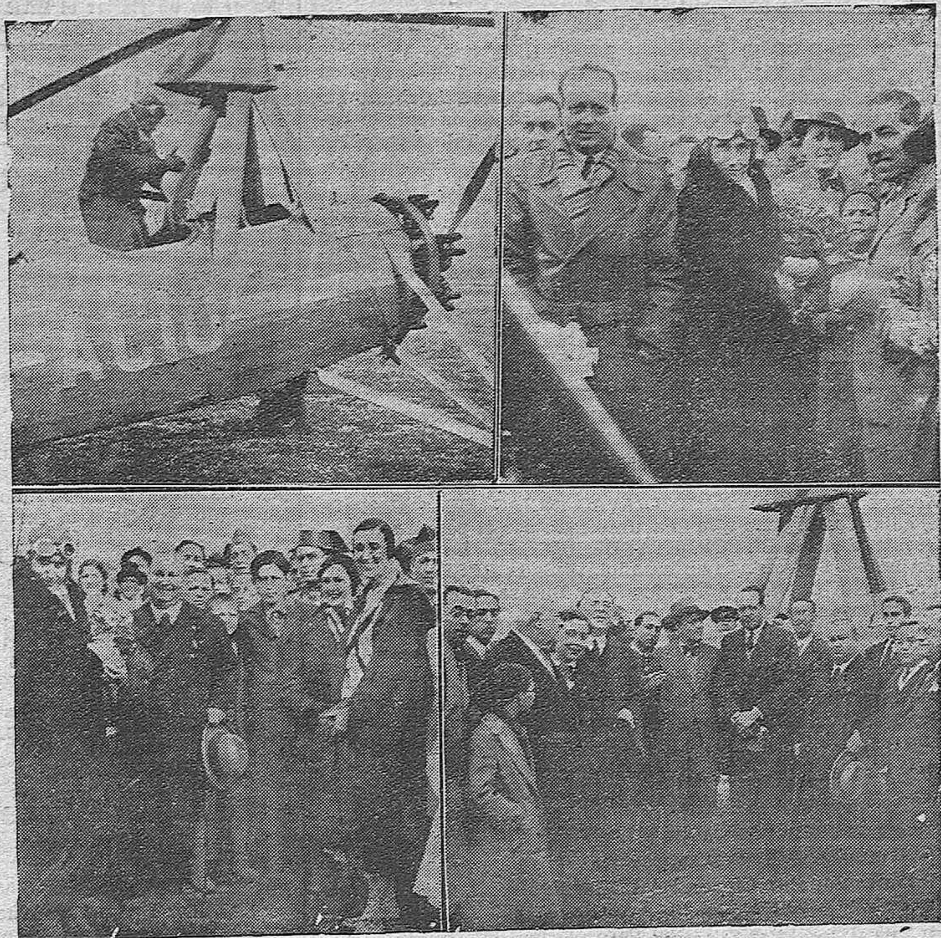
Núm. 1.-Llegada del autogiro. Momento de descender el señor La Cierva del aparato.—Núm. 2.-E. señor La Cierva con su distinguida esposa.—Núm. 3.-El alcalde de Córdoba entrega un ramo de flores a la señora de La Cierva.—Núm. 4.-Las autoridades y aviadores civiles y militares con el ilustre inventor.