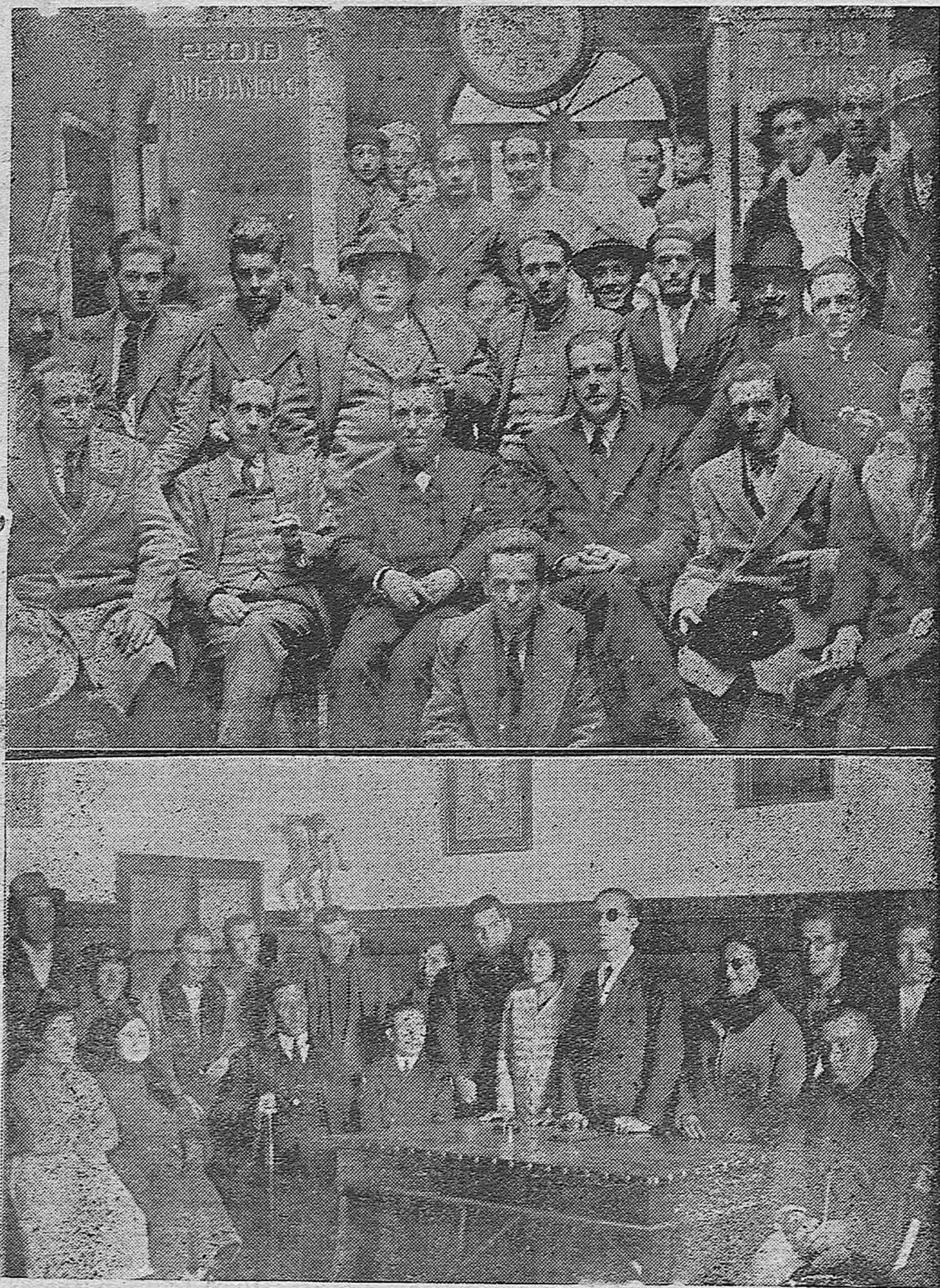
FOTAS GRAFICAS.—Asistentes al banquete que celebraron los drogueros.—Se organiza la Asociación de ciegos.—Presidencia de la Asamblea