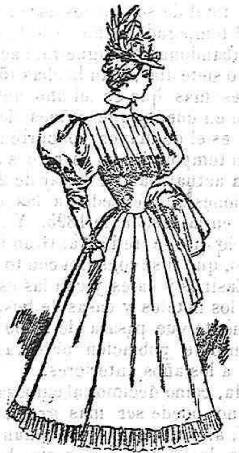
Traje para paseo.

Este airoso traje se compone de un cuerpo en forma de chaqueta entallada, con aldetas acampanadas, llevando el delantero abrochado por alamares de pasamanería y abierto, con un peto de terciopelo. Corresponde á este cuerpo un doble cuello con solapas, también de terciopelo, adornándose éstas con un borde de pañete de distinto tono. Para no desmerecer del conjunto, es preciso que sean las mangas al biés, con carteras del mismo género de las solapas y la falda en forma de campana.