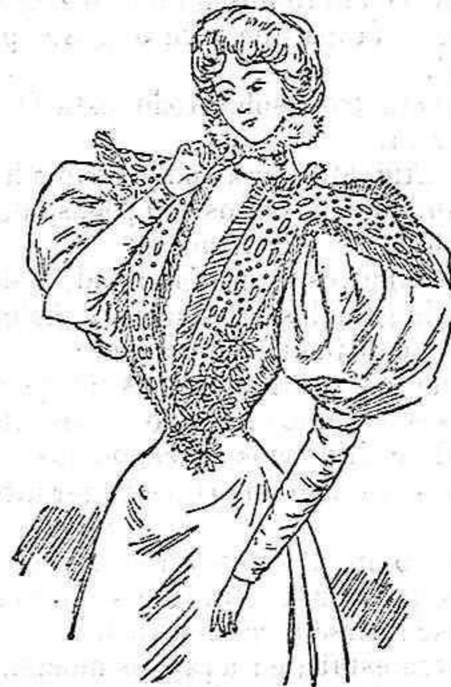
Traje para visita.

Modelos exclusivos para nuestras lectoras, de los grandes almacenes de EL SIGLO, Barcelona (1).