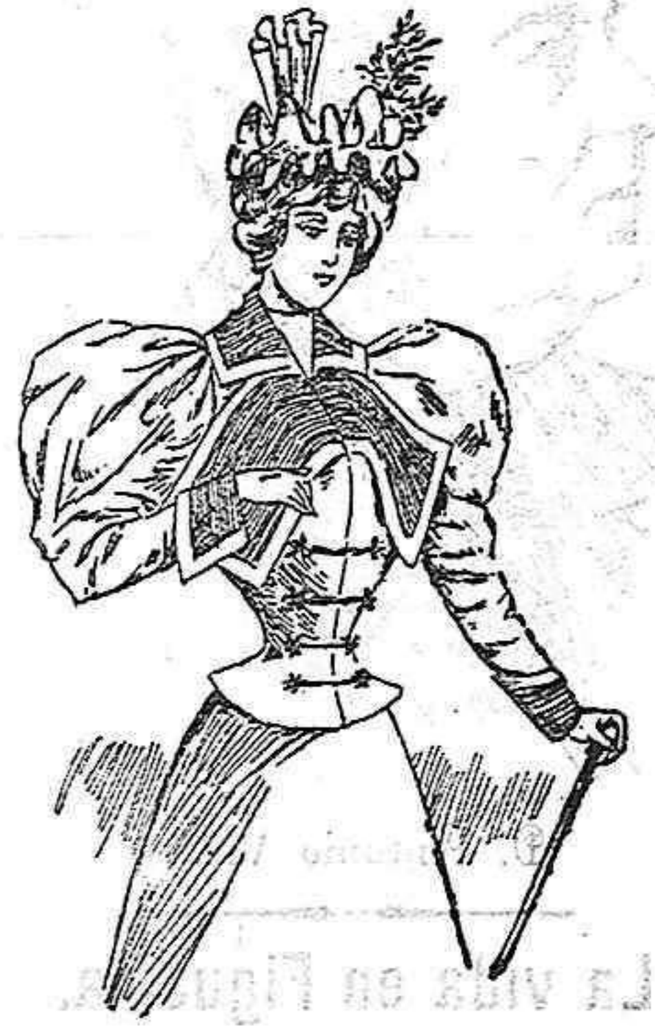
Traje de entretiempo.

Cuando fué Fortuny á Marruecos (1850) comisionado por la Diputación de Barcelona, para que tomara apuntes sobre el mismo teatro de la guerra el entonces joven artista, iba ansioso de luz y de colores. Su suerte fué grande, pues, el país, y las circunstancias especiales que le rodeaban, su sol espléndido y su cielo purísimo le ofrecieron en abundancia todo lo que él deseaba.