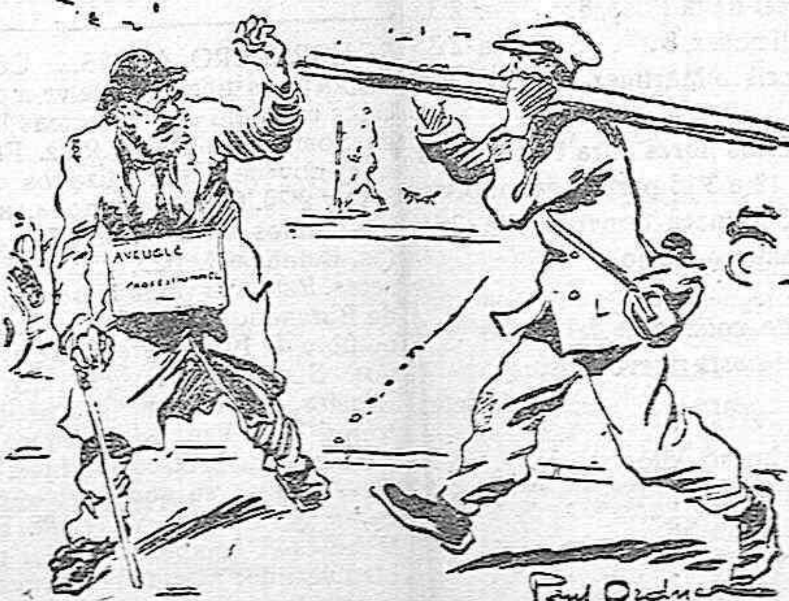
EL CIEGO.—¡Cuidado hombre, que me va usted a dejar tuerto!

Un PLATANO alimenta tanto como un huevo y cuesta mucho menos.