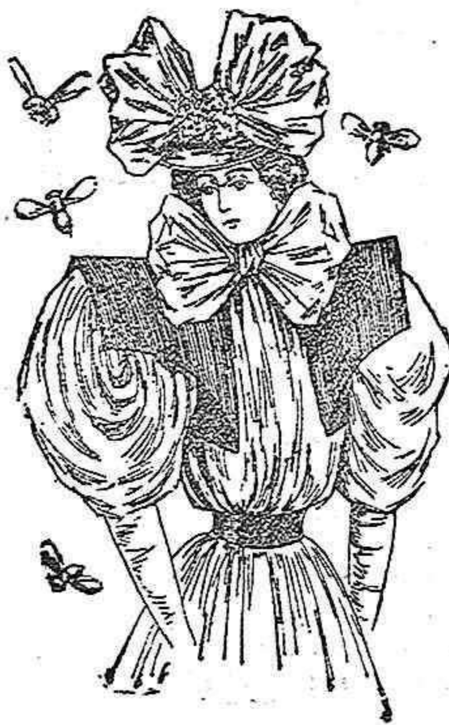
Traje para campo.

De lana, última novedad. Cuerpo entallado. Delantero abierto sobre un plastrón de moaré, que recoge la tela en el hombro y un bonito galón bordado que pasa por la espalda y delantero derecho, llevando en la cintura tres patas del mismo galón. Cuello con dos lazadas de cinta y una hebilla. La manga de una pieza y la falda lisa en forma de campana.