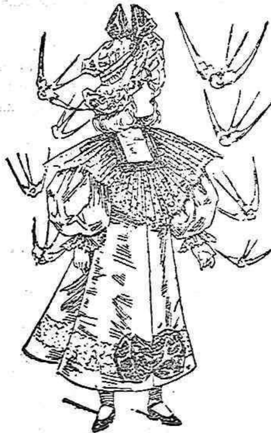
Traje para niña de seis años.

Modelos exclusivos para nuestras lectoras, de los grandes almacenes de EL SIGLO, Barcelona (1).