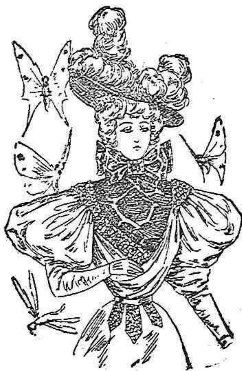
Traje para paseo.

De lana, última novedad. Cuerpo entallado. Delantero abierto sobre un plastrón de moaré, que recoge la tela en el hombro y un bonito galón bordado que pasa por la espalda y delantero derecho, llevando en la cintura tres patas del mismo galón. Cuello con dos lazadas de cinta y una hebilla. La manga de una pieza y la falda lisa en forma de campana.