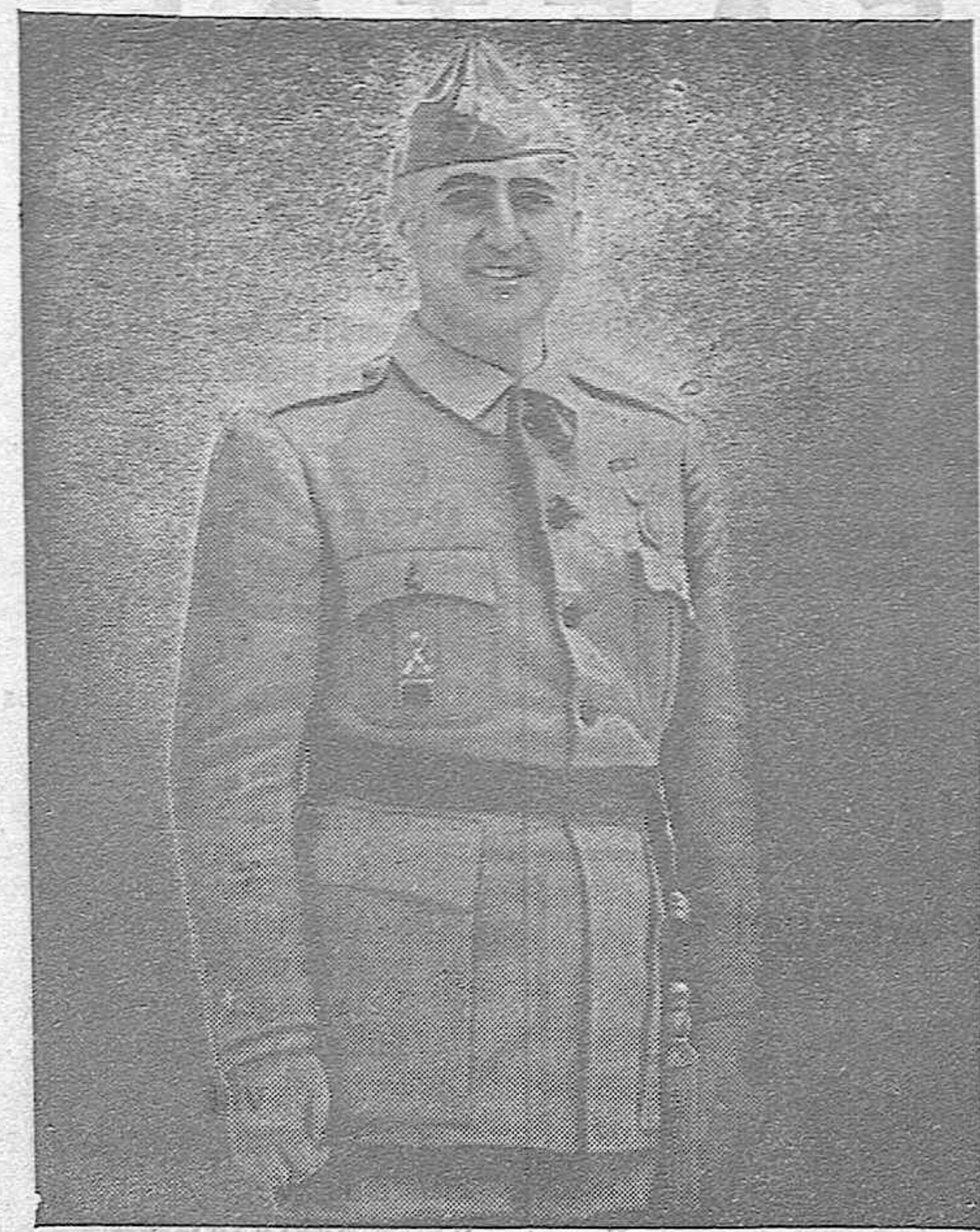
El jefe del Estado, excelentísimo señor don Francisco Franco Bahamonde, Generalísimo de los Ejércitos Nacionales y salvador del honor de España