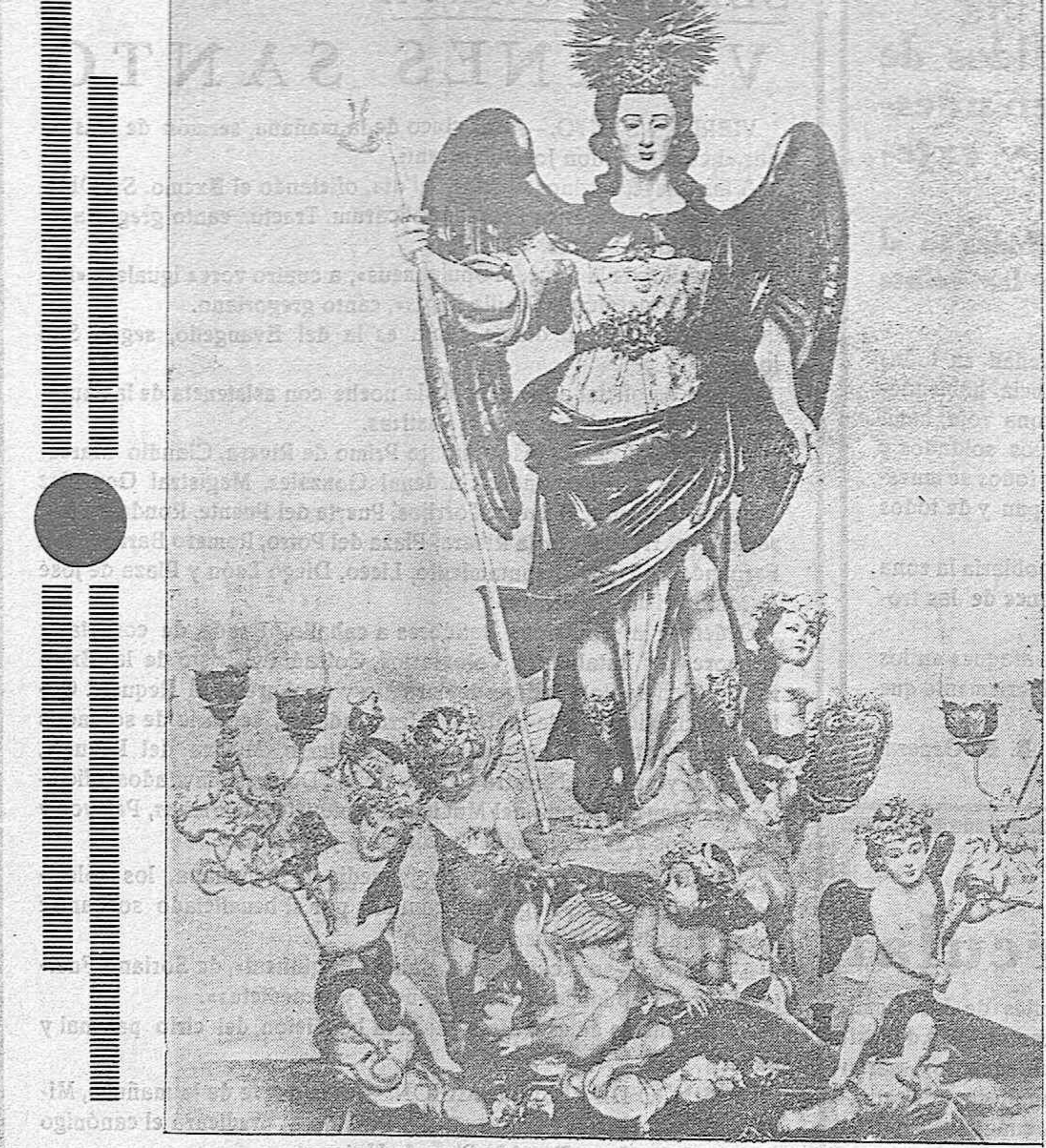
El límpido cielo azul cordobés sonríe con fiestas primaverales, bajo las alas tulares de su Angel Custodio San Rafael.