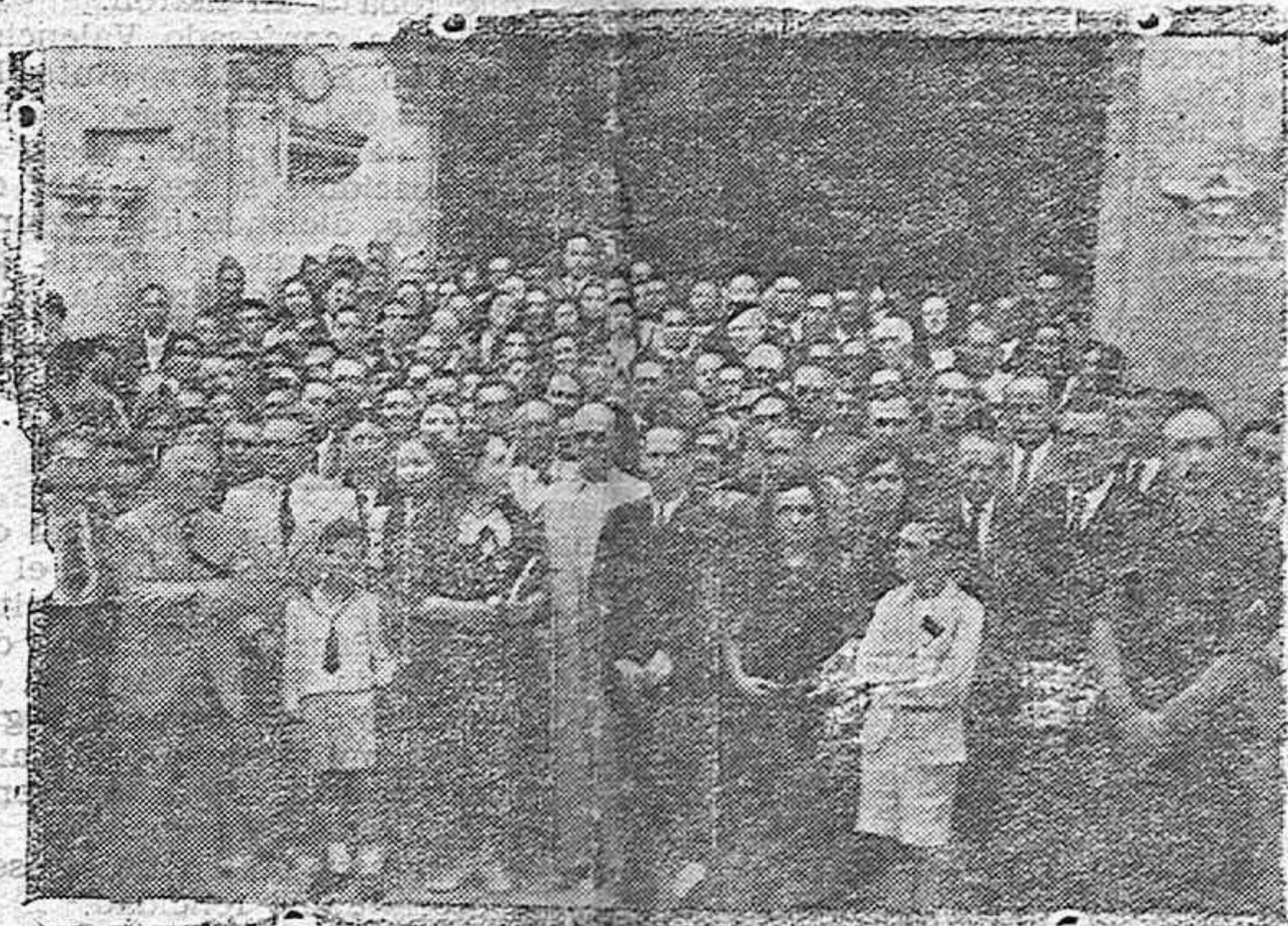
Los maestros que asistieron a los Cursos de formación profesional visitaron la Mezquita-Catedral de Córdoba