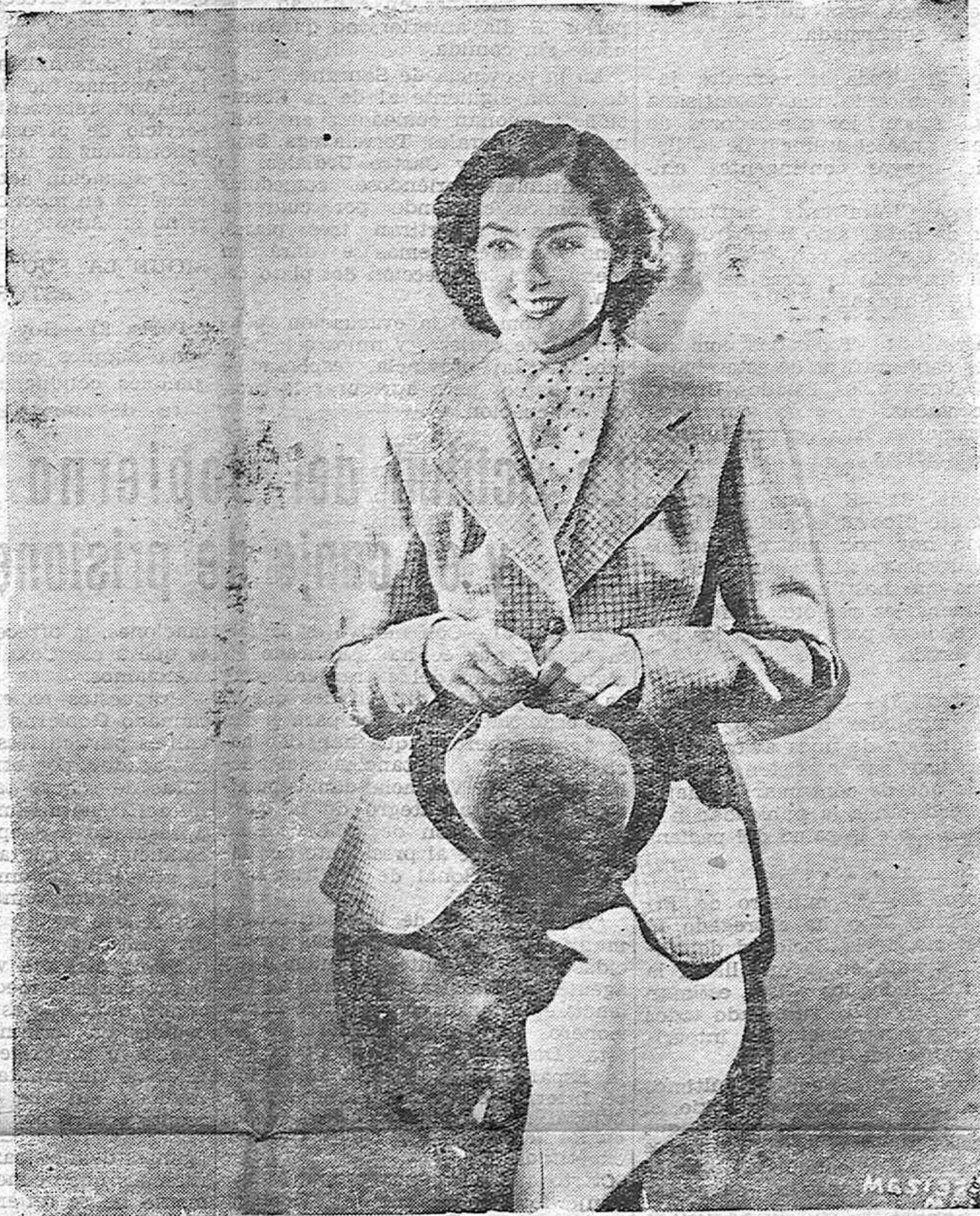
Rosalind Russell, ha alcanzado un puesto de primera línea entre todas las artistas famosas del Cine, por su distinción, su elegancia, y su naturalidad.