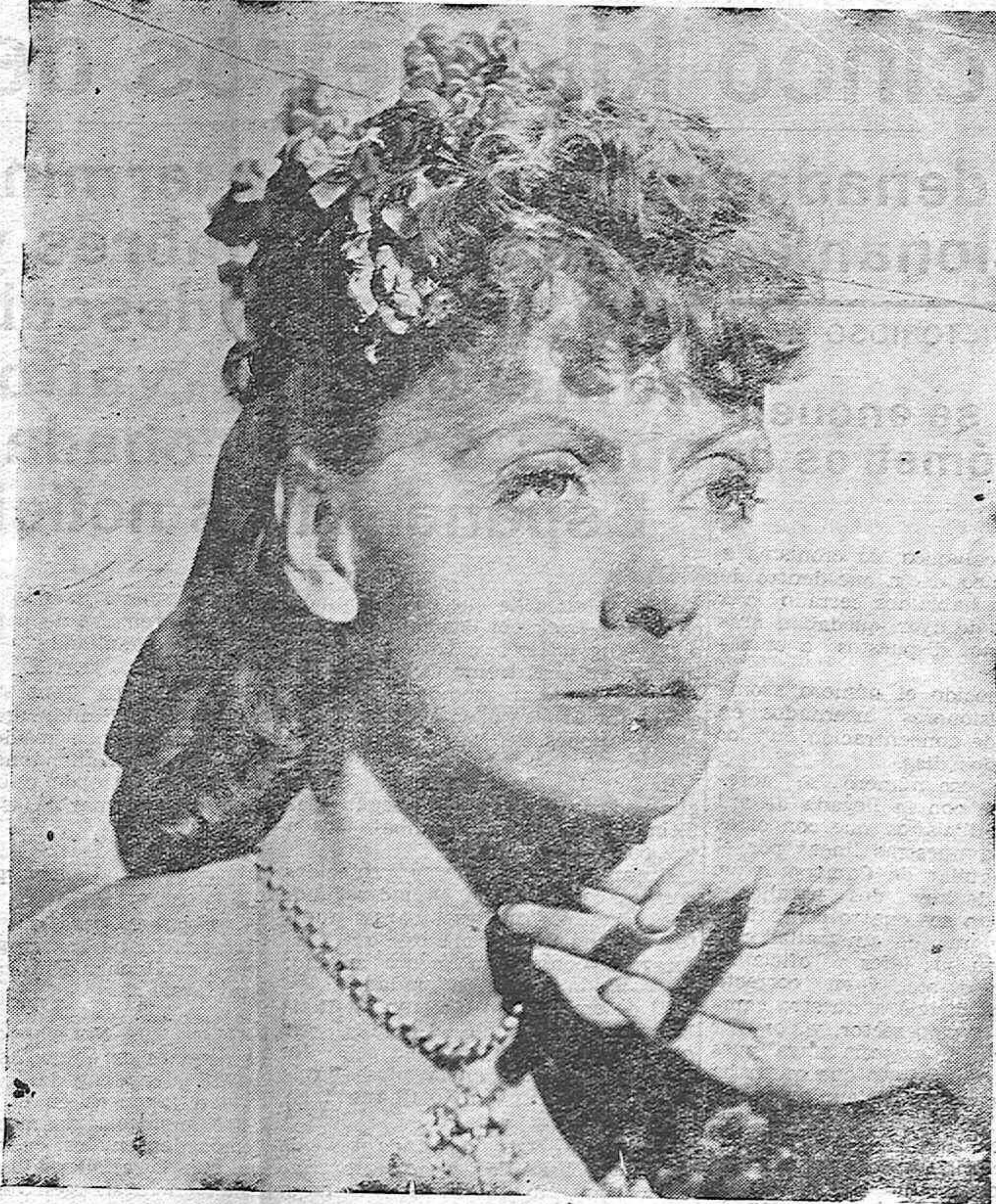
He aquí a Greta Garbo. Ella es la más alta figura del Cine mundial

Almacenes Porras Rubio S. L. COLONIALES POR MAYOR Oficinas y Despacho: PEREZ GALDÓS, 8. Almacenes: 12 DE OCTUBRE.-Tef. 1556