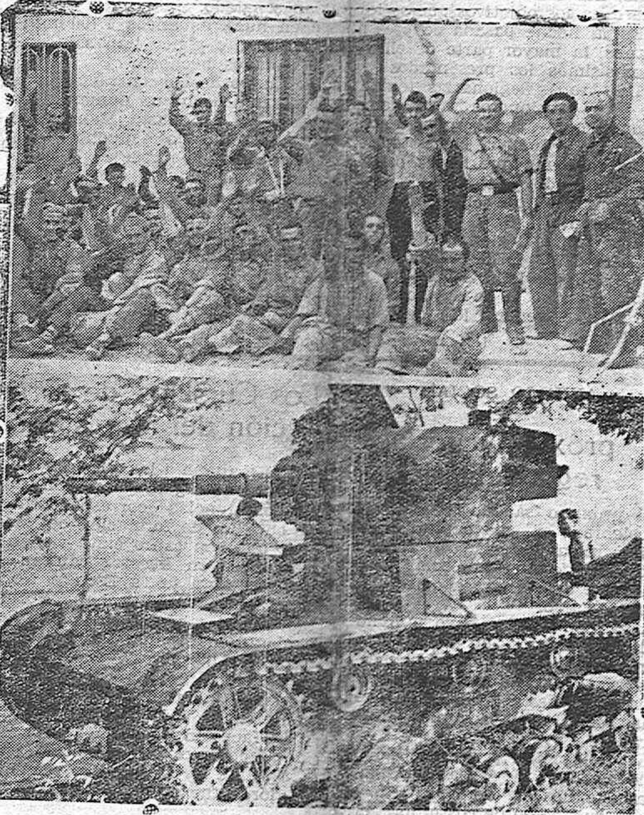
Prisioneros cogidos al enemigo en Brunete. En tanque ruso quitado en Brunete a los rojos.