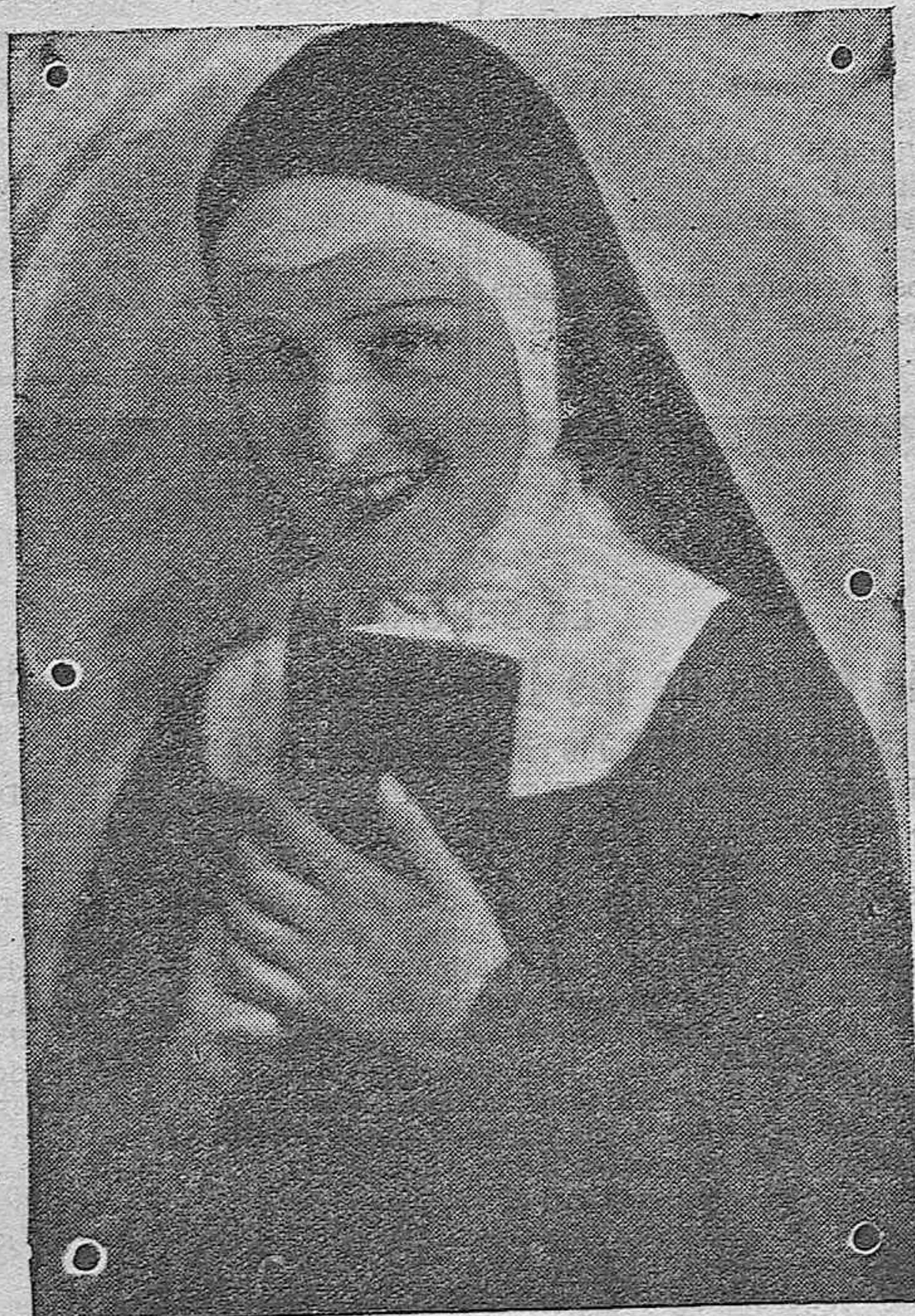
IMPERIO ARGENTINA EN LA PELÍCULA CIFESA "LA HERMANA S. SULPICIO"