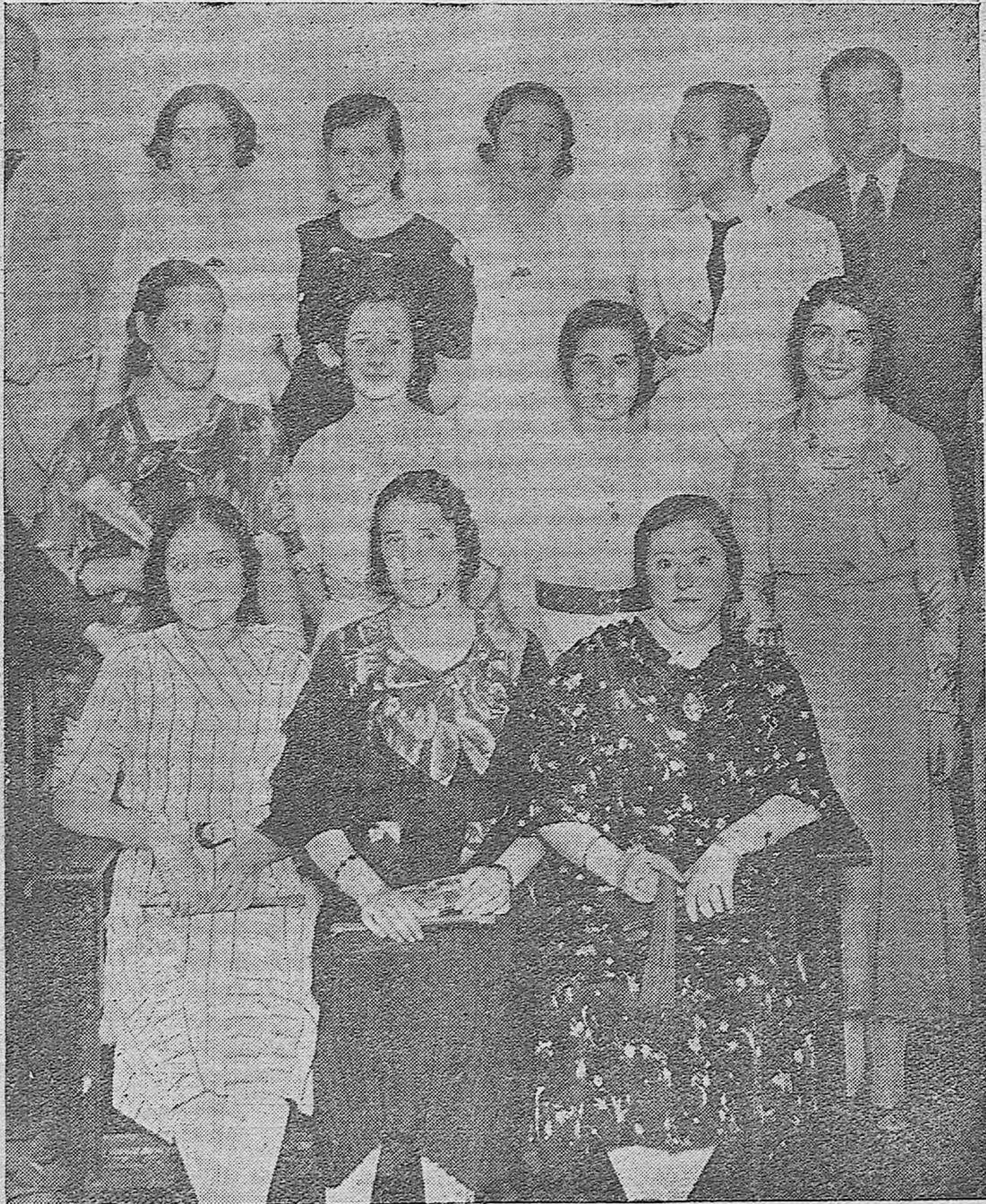
Grupo de bellas y distinguidas señoritas de Fuente Obejuna, que asistieron a la entrega de premios del Concurso Comarcal de Ganados, celebrado en aquella villa.