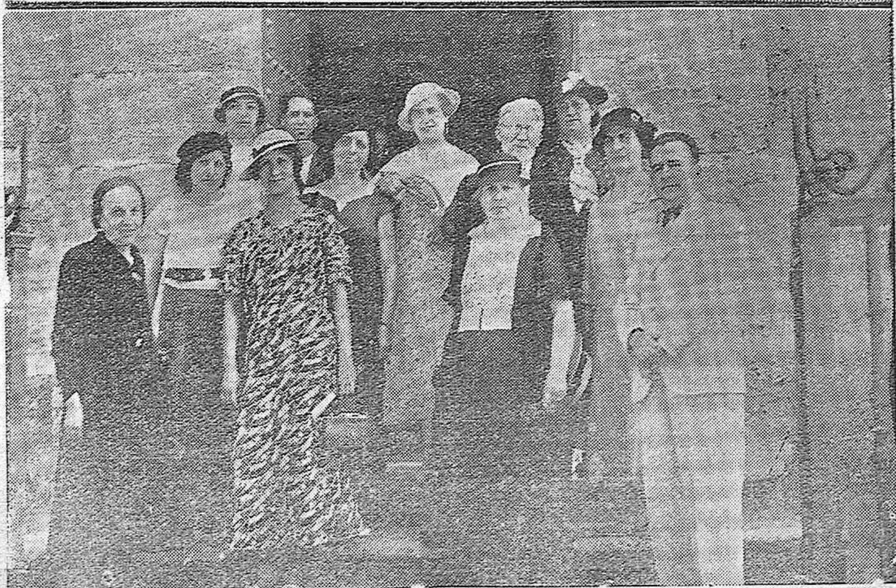
Profesores de la Facultad de Perpiñán que acaban de llegar en viaje de estudios.—Permanecerán dos días en nuestra capital para visitar los monumentos importantes.