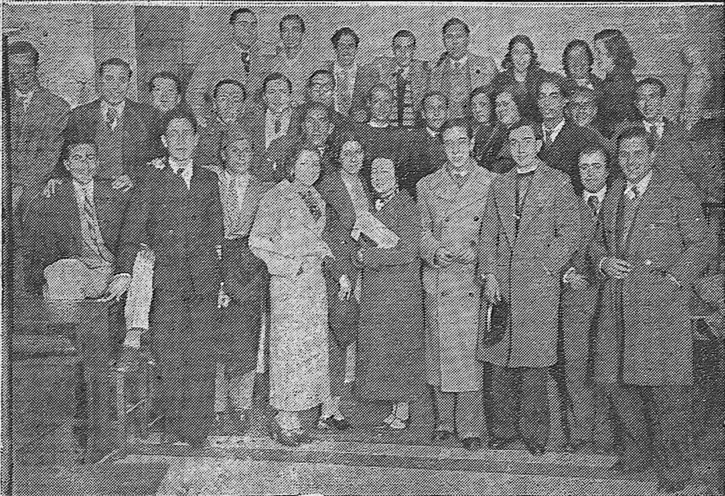
Bellas señoritas pertenecientes al Ropero del Obrero con las ropas que han confeccionado para repartírselas a niños pobres.—Abajo: Asamblea de maestros nacionales del plan de estudios 1914 celebrada en la Escuela Normal para acordar ciertas mejoras profesionales.