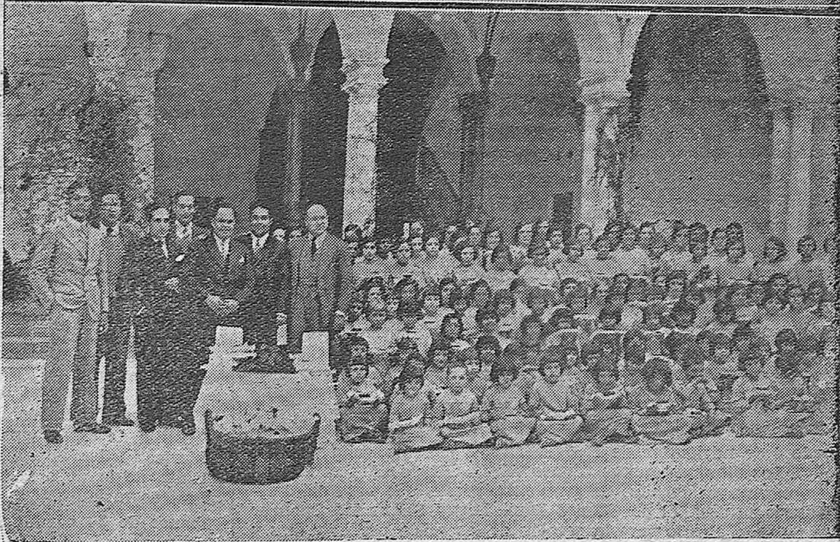
NOTAS GRAFICAS. —Reparto de chocolate y panecillos con que obsequió ayer la fábrica de chocolates "Virgen de los Reyes" de Sevilla a los acogidos en el Hospicio.