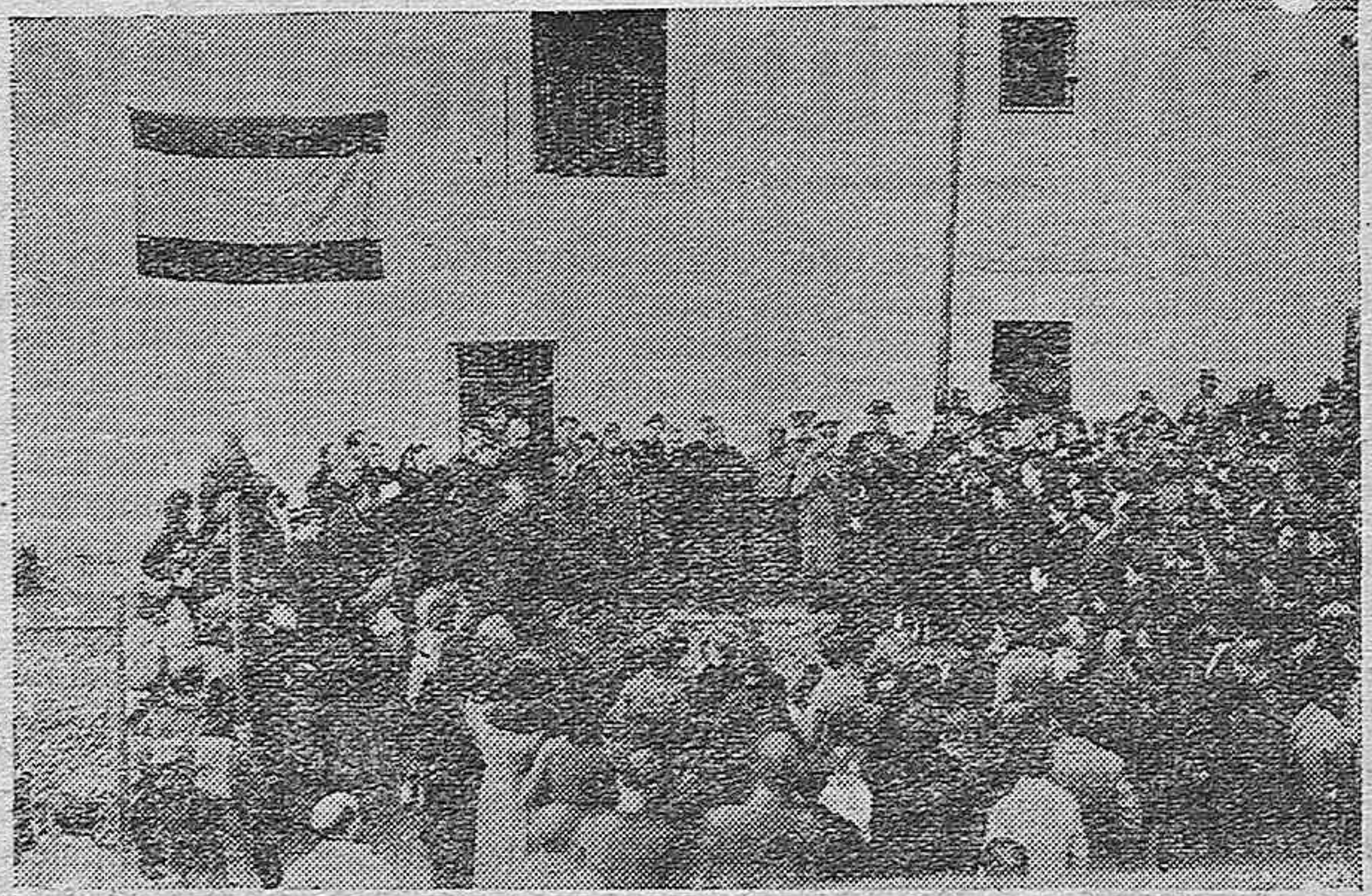
Uno de los momentos del acto celebrado en Villafranca, de honda emoción patriótica y del cual hemos publicado amplia información en AZUL.