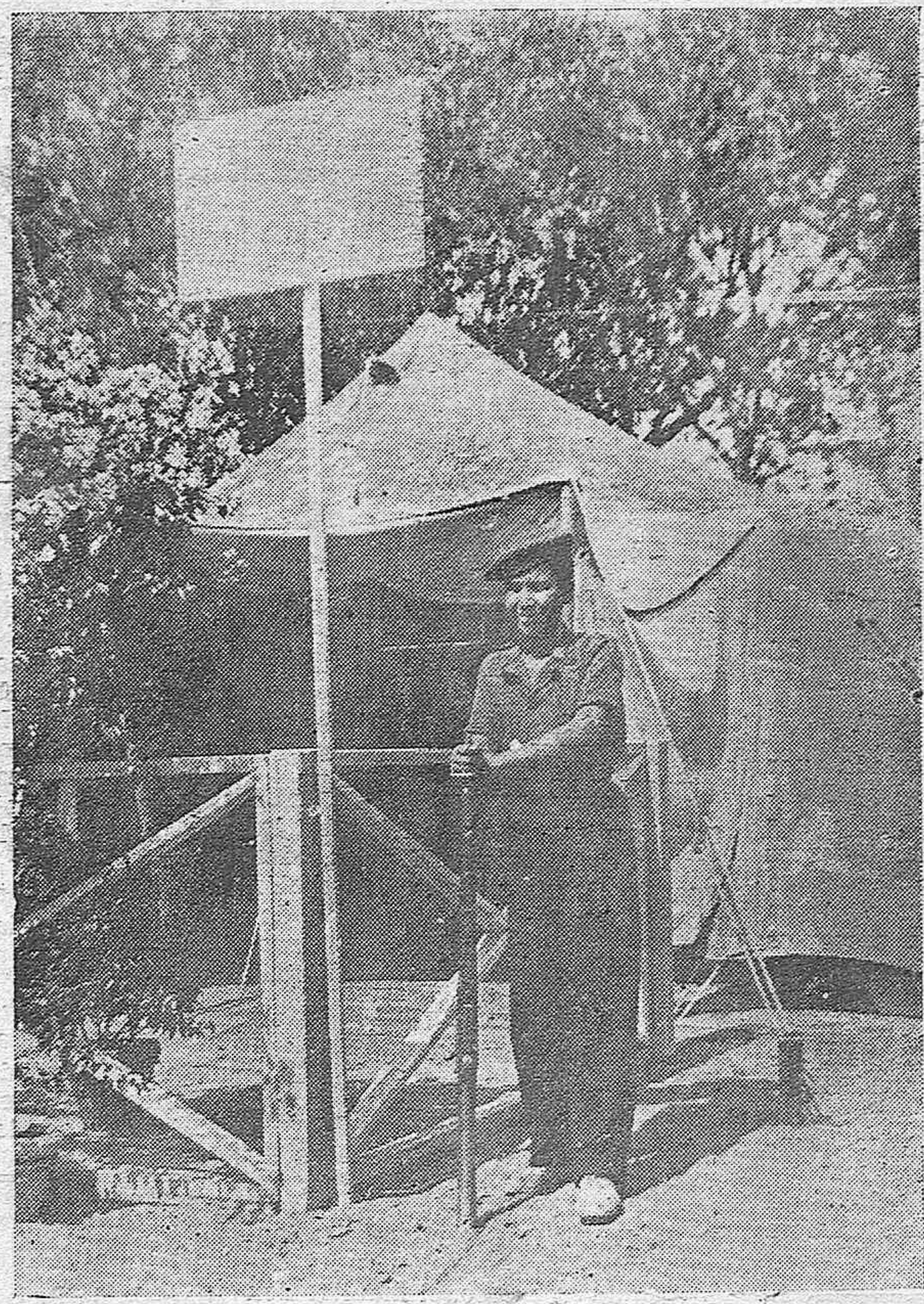
La tienda de campaña del mando de nuestros fechos, en el "Campo de España" de Italia, durante la estancia de la representación de la Organización Juvenil española en la nación hermana.

DIARIO DE FALANGE ESPAÑOLA TRADICIONALISTA Y DE LAS J. O. N. S.