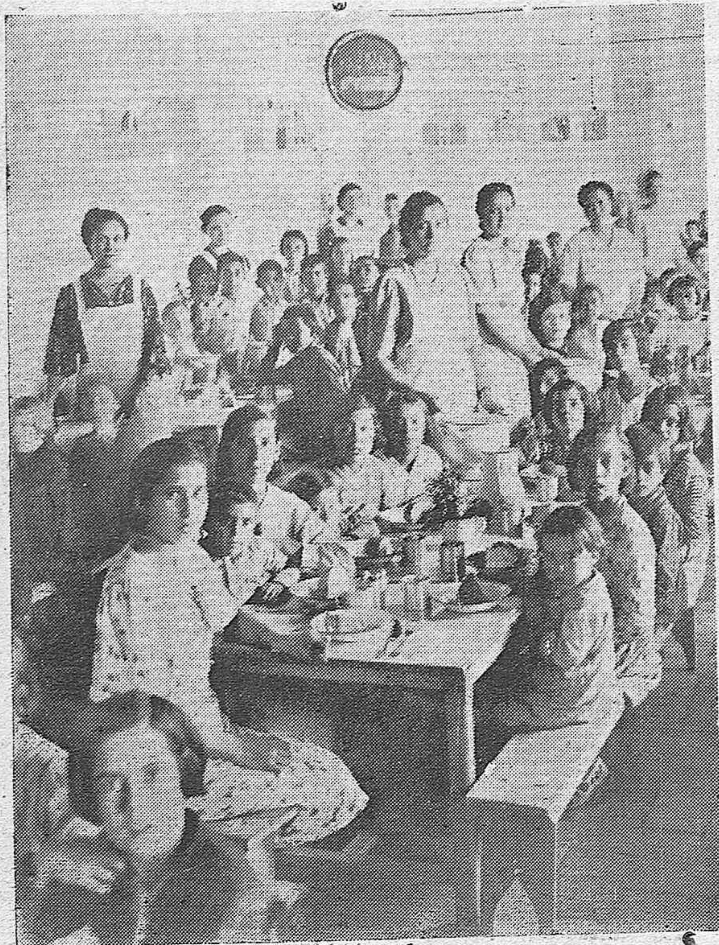
El Comedor que fué del "Cocido del Niño" anexionado ya al "Auxilio Social".—Nuestras camaradas reparten el diario alimento entre los pequeños.