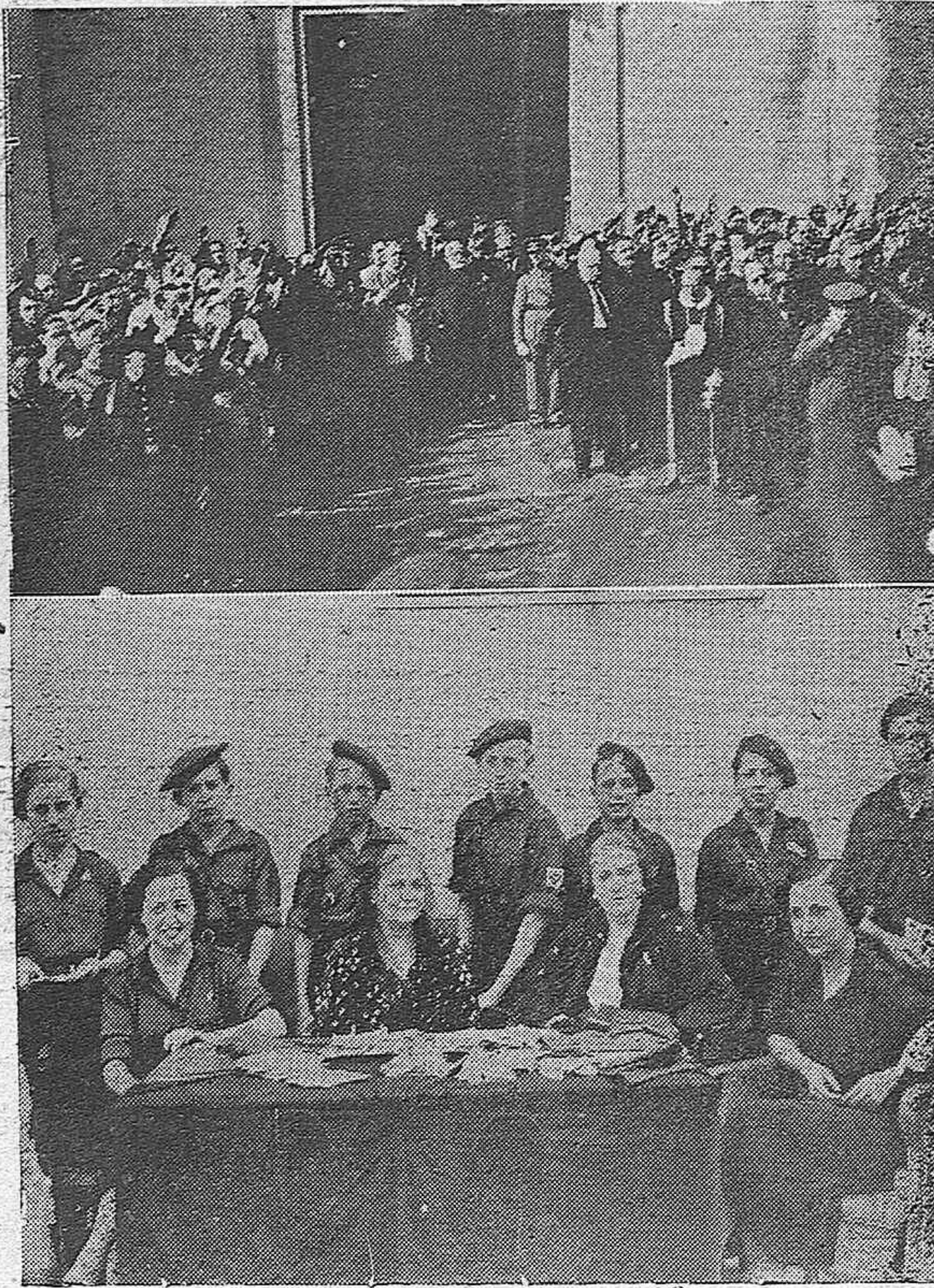
LA "FIESTA NACIONAL DEL CAUDILLO" EN CORDOBA.-Autoridades al salir de la Catedral, después del Te Deum.-Una de las mesas de recaudación instaladas en la capital.

DIARIO DE FALANGE ESPAÑOLA TRADICIONALISTA Y DE LAS J. O. N. S.